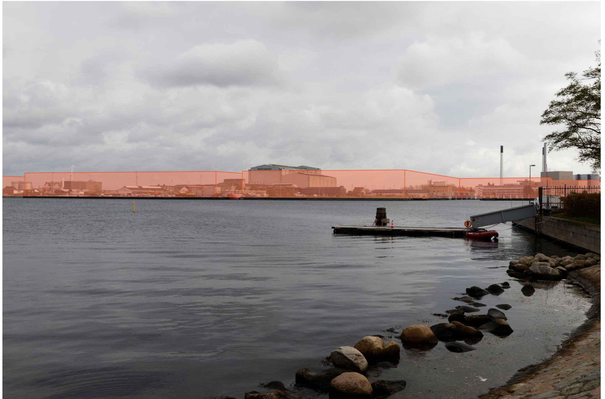
Figur 20 Fotostandpunkt 5 Øst – fremtidige forhold set fra Kastelet. Her ses hvordan bydannelsen på Refshaleøen, påvirker udsigten fra fotostandpunktet. Sektionshallen på Refshaleøen vil stadig være dominerende for områdets skala.