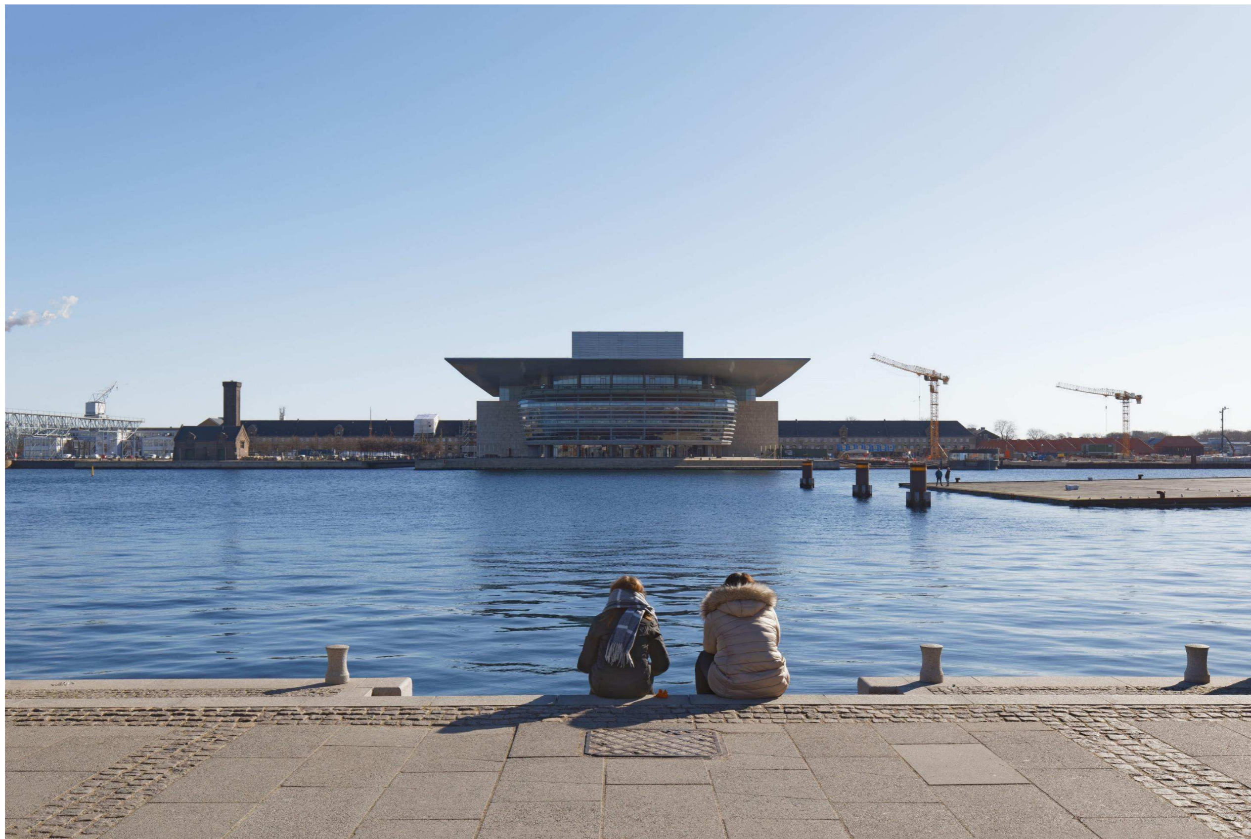
Figur 24 og 25 Fotostandpunkt 7 øst – eksisterende forhold og 0-alternativet set fra Amalienborg sigtelinjen. 0-alternativet er tilsvarende de eksisterende forhold, da hverken Nordhavn eller Lynetteholm kan ses fra fotostandpunktet. 0-alternativet viser udsynet fra fotostandpunktet, hvis planen ikke gennemføres.