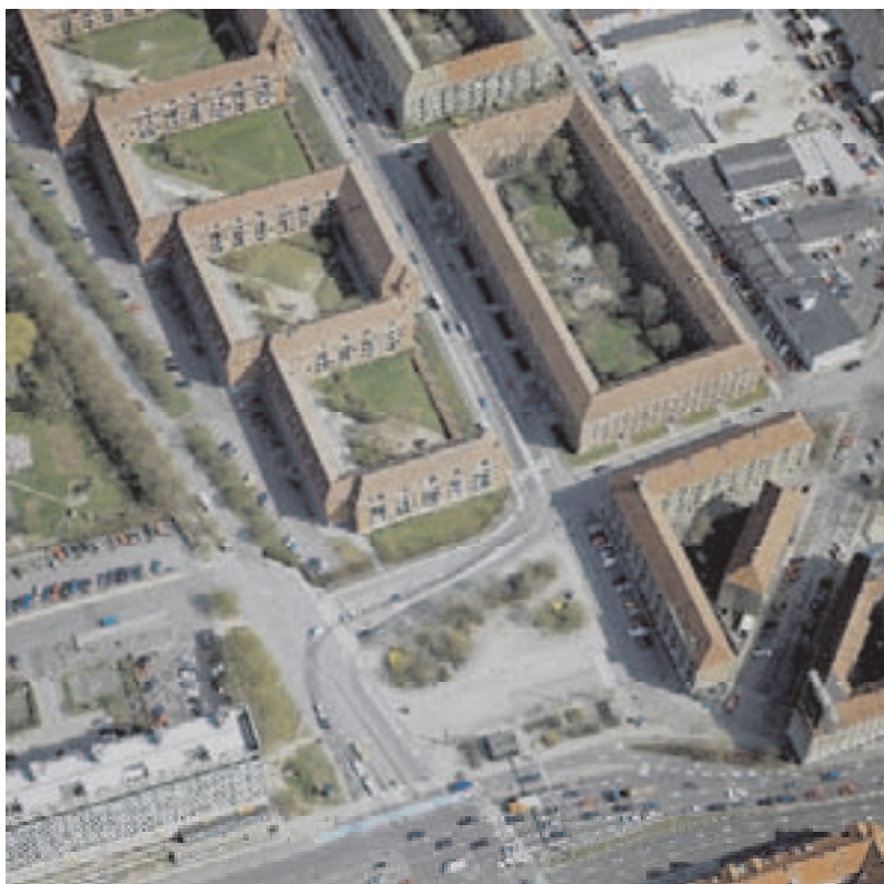
Luffoto - eksisterende forhold