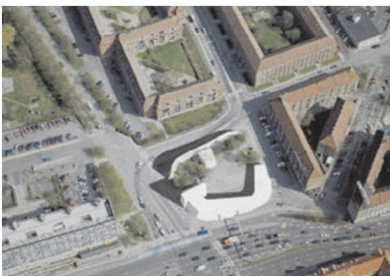
Forslag 3 Bebyggelsesstrukturen koncentrerer sig mod Lyngbyvej, Borgervænget og Vognmandsmarken i en hesteskoformet struktur, der omstutter en mindre pladsdannelse. Mod Glænøgade etableres en støjmur, evt. med ilagte funktioner.