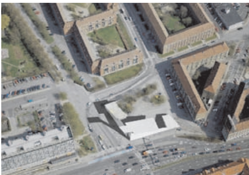
Forslag 2 Bebyggelsesstrukturen koncentrerer sig mod Lyngbyvej og Borgervænget. Der etableres en mindre pladsdannelse mod Vognmandsmarken/ Glænøgade.