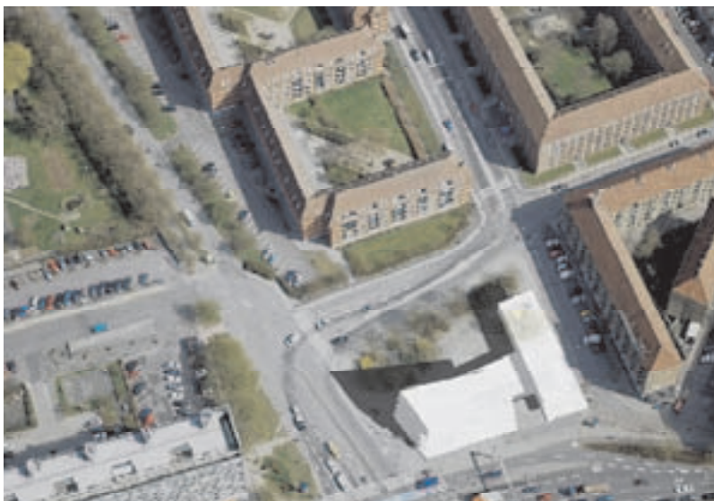
Forslag 1 Bebyggelsesstrukturen koncentrerer sig mod Lyngbyvej og Vognmandsmarken. Der etableres en mindre pladsdannelse mod Borgervænget/Glænøgade.