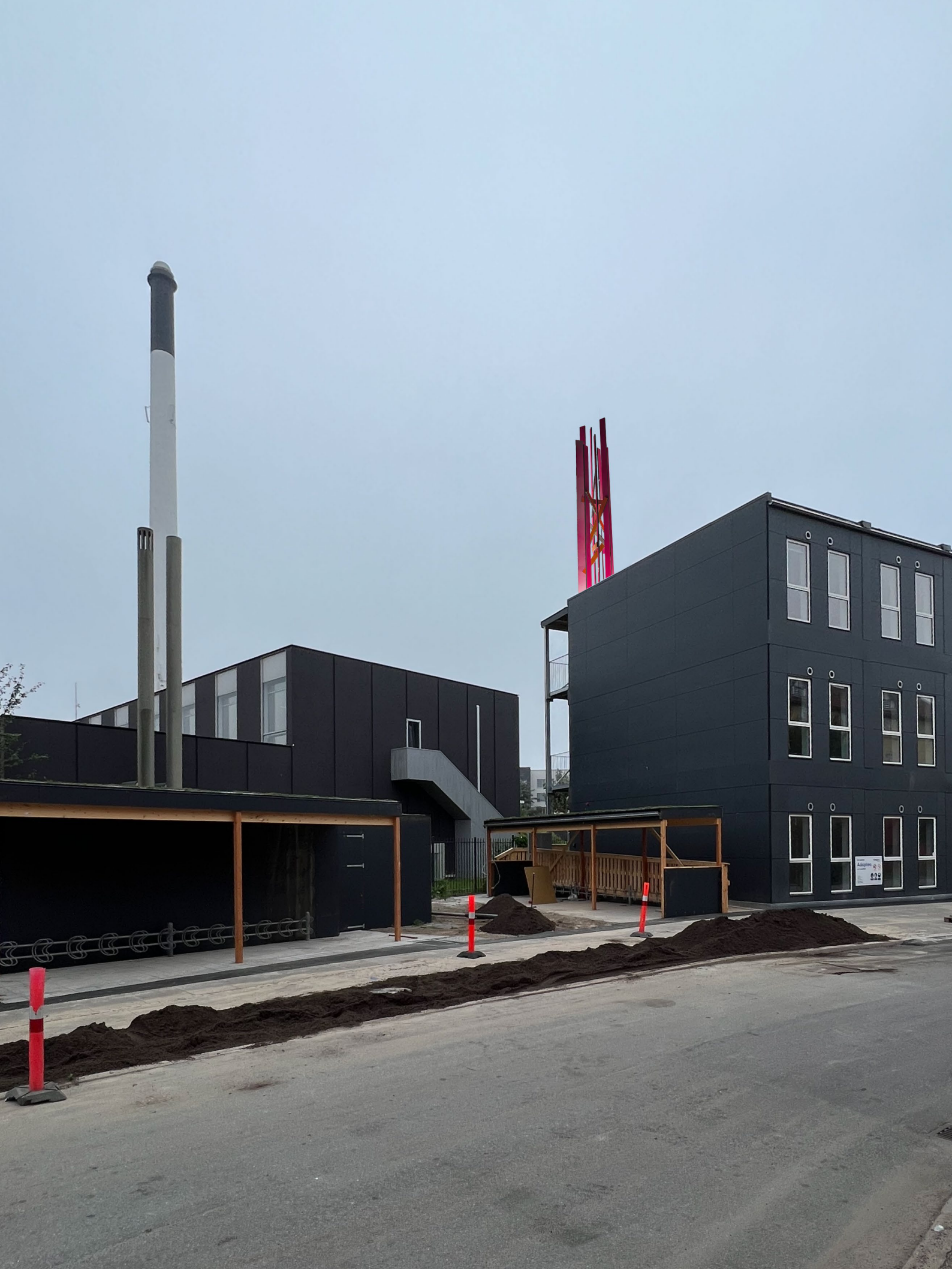
Illustration: Nær miljøet med Hofors store skorstene i baggrunden.