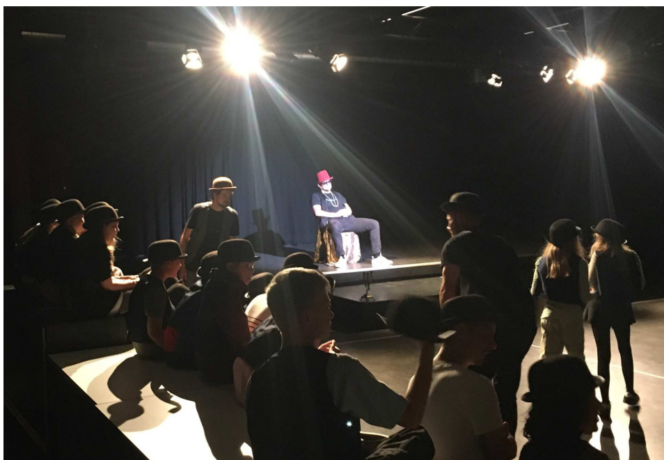
Skoleworkshop "Kampen om Grundloven", Stairway sept. 2024