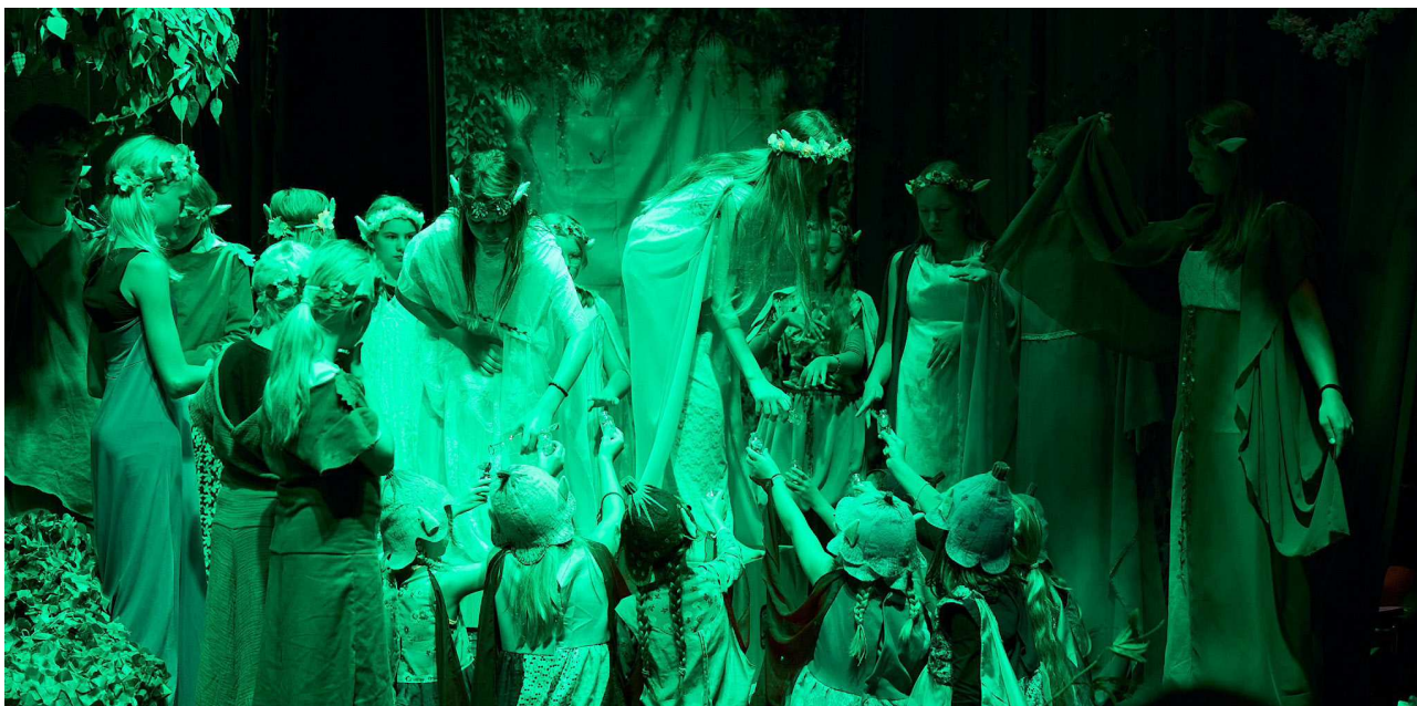
En Skærsommernatsdrøm, sommercamp, juli 2024

Målgruppe: Visningerne er gratis og åbne for alle interesserede