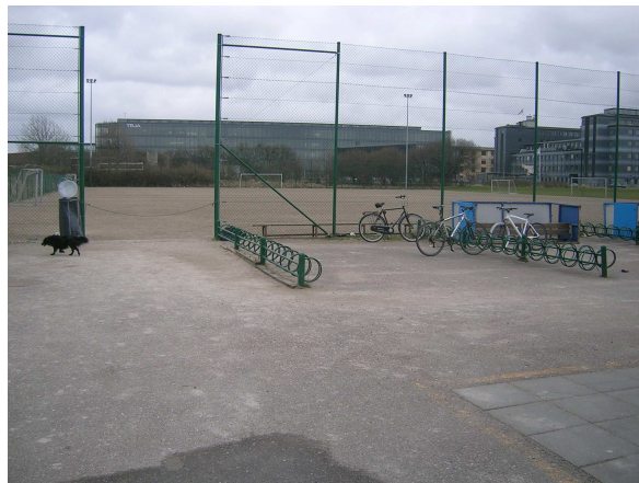
Sundby Boldklub. Klubhuset blev indviet i januar 2000 efter at klubben måtte flytte fra Amagerbro Idrætsanlæg. Til klubhuset hører grusbanen på billedet samt tre græsbaner.