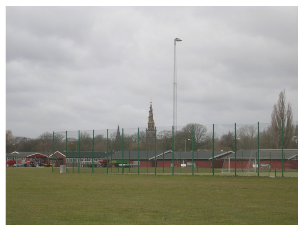
Barakbyen Kløvermarkens Idrætsanlæg, som huser flere forskellige klubber. En del af bygningerne stammer tilbage fra flygtningelejrens tid. Umiddelbart op ad bygningerne ligger 3 kunstgræsbaner.