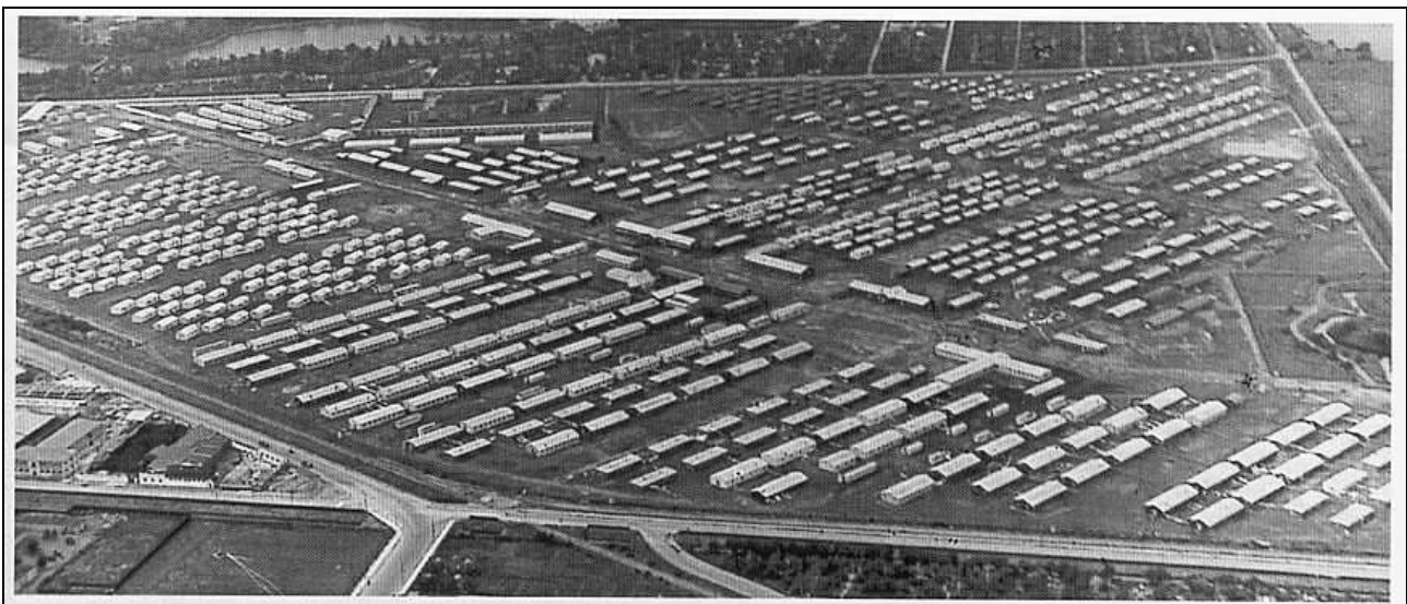
Billedet er fra 1946. De første år fyldte lejrens barakker hele området.

I dag er der ingen spor efter flygtningelejren på Kløvermarken.