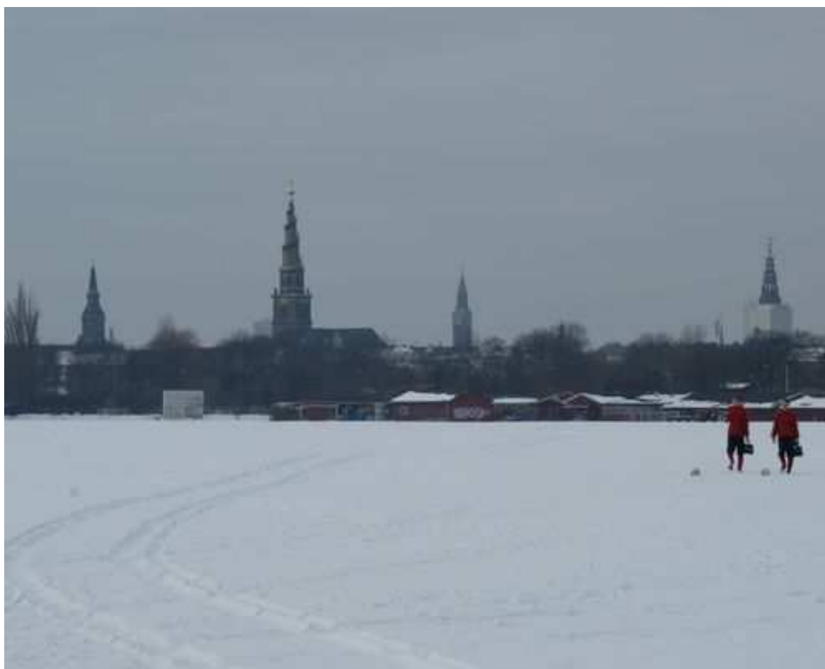
Fodboldentusiaster trodser vejret.