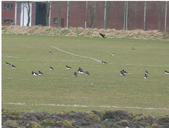
En hund samler affald på Kløvermarken – her en vandflaske, som måske er glemt af en spiller efter en kamp. Mange steder sidder fuglene i store flokke, her er det strandskader i straffesparkfeltet med en råge kredsene overover.