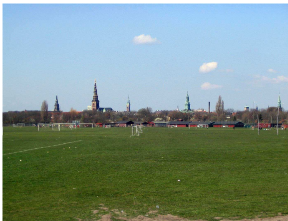
Prøvestenens siloer og Lynettens vindmøller danner bagtæppet mod øst, mens byens tårne er et unikt panorama mod vest.