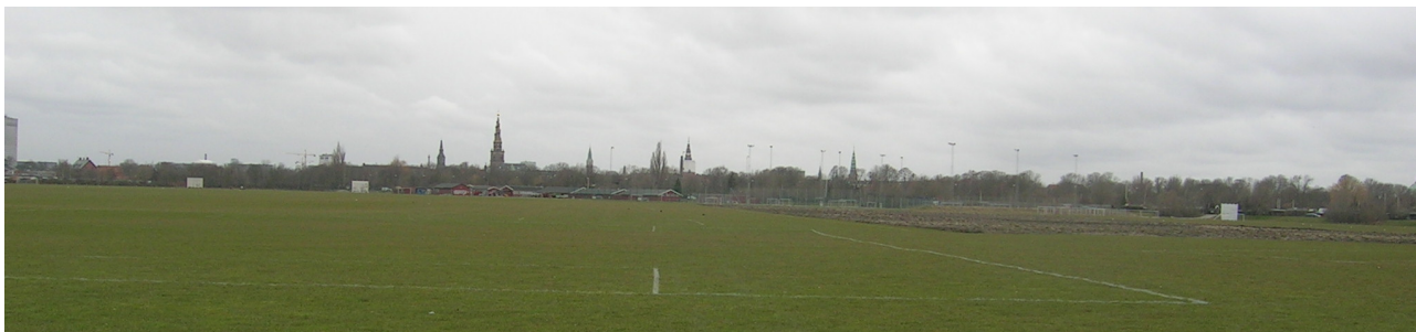
Københavns skyline.

Kløvermarken er knap 38 ha og ejes i sin helhed af Københavns Kommune. Området afgrænses af Uplandsgade, Raffinaderivej og Kløvermarksvej.