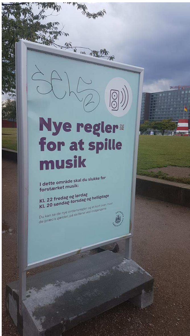
Skiltet står på Islands Brygge i dag

(Medlemmer er deltagere i Miljøgruppen. CC er de personer, som ønsker at være orienteret om Miljøgruppens arbejde)