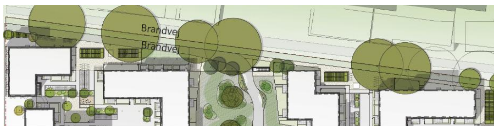
Illustration Årstiderne arkitekter

Ovenfor ses vejforholdene der ønskes dispenseret fra. I venstre side ligger to parallelle brandveje/stier placeret på hver sin matrikel. Nedenfor en sammenlægning af stierne og et langstrakt bed til en ny poppelrække.