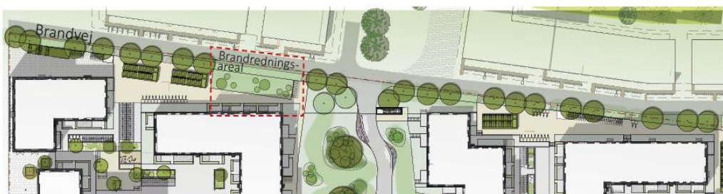
Illustration Årstiderne arkitekter