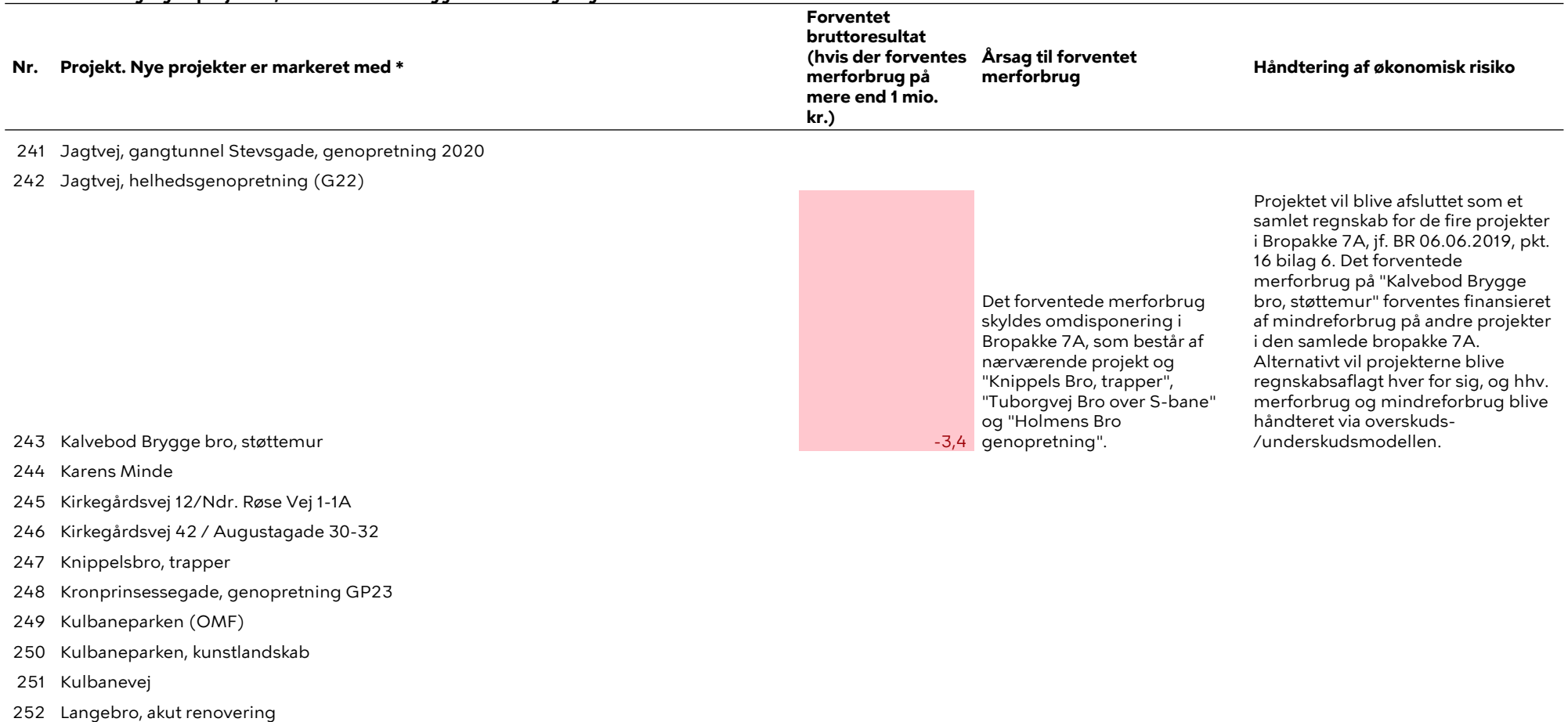
Tabel 3. Ibrugtagne projekter, der afventer aflæggelse af anlægsregnskab