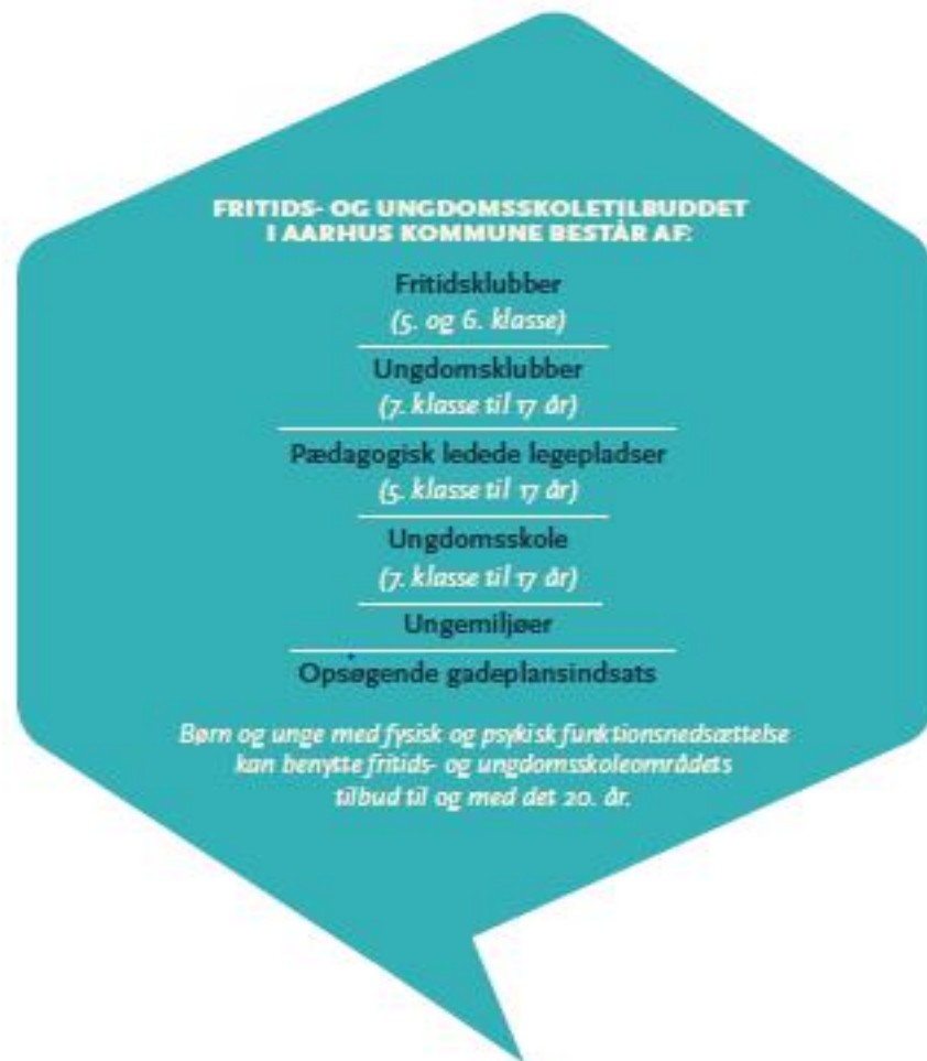
Figur fra "Ung i Aarhus"

Gadeplansindsatsen er en del af Aarhus Gadeplan og ovenstående fremhæves som et afgørende, operationelt redskab i kriminalitetsforebyggelsen i udsatte boligområder, lokaldistrikterne og i byen som sådan.