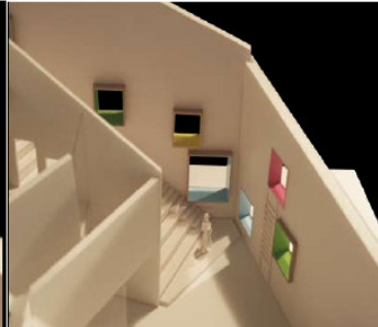
HYLDERNE - PERSONLIGE RUM MELLEM UDE OG INDE, SOM SKABER GODE OG VARIEREDE IVCIMPTAG