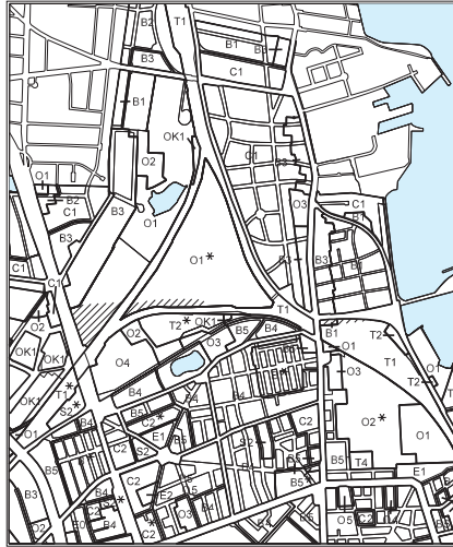
Eksisterende rammer i Kommuneplan 2005.

Rammerne for lokalplanlægning ændres for områderne, vist på de følgende tegninger.