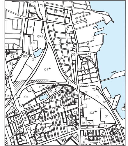
Forslag til rammeændringer (vist med skravering). O1-området øst for Helsingørmtorvejen, O1*-området ved Svanemøllens Kaserne, B1 og T1 områderne ved Strandvænget, reduceres for at give plads til vejlægget.