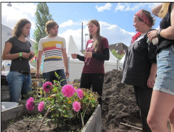
”Byg en byhave”-workshop under Smag Verden.

Derudover er Miljøpunkt Amager i gang med at planlægge afholdelse af en større konference for de københavnske byhaver i forbindelse med Miljøfestivalen. Konferencen bliver afholdt den 11. oktober og med aktiviteter på Prags Boulevard 43.