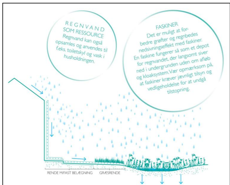
Tegning fra folderen "Vand i kælderen – Nej tak!"

udarbejdet et nyhedsbrev til grundejerforeningerne hvor Miljøpunkt Amagers forskellige indsatser og tilbud indenfor klimatilpasning og LAR-løsninger er specificeret. Dette nyhedsbrev blev udsendt i juni måned.