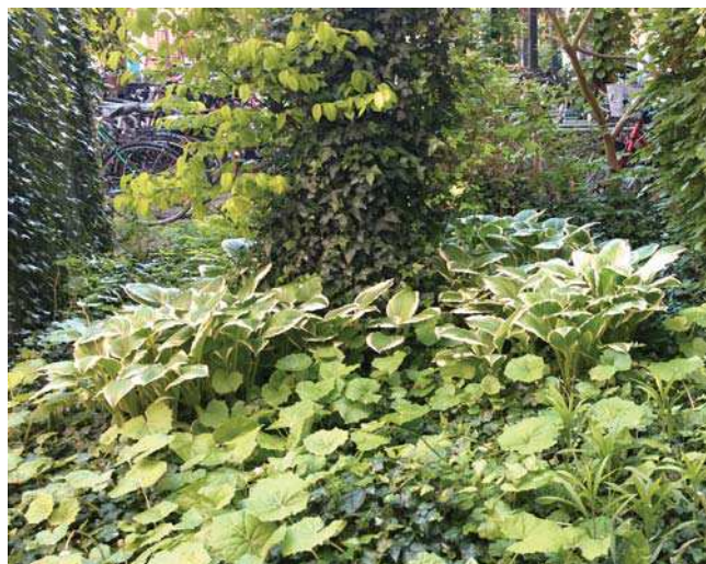
Inspiration til den fremtidige gårdhave