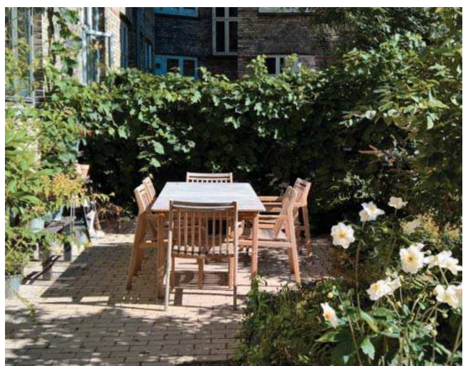
Inspiration til den fremtidige gårdhave