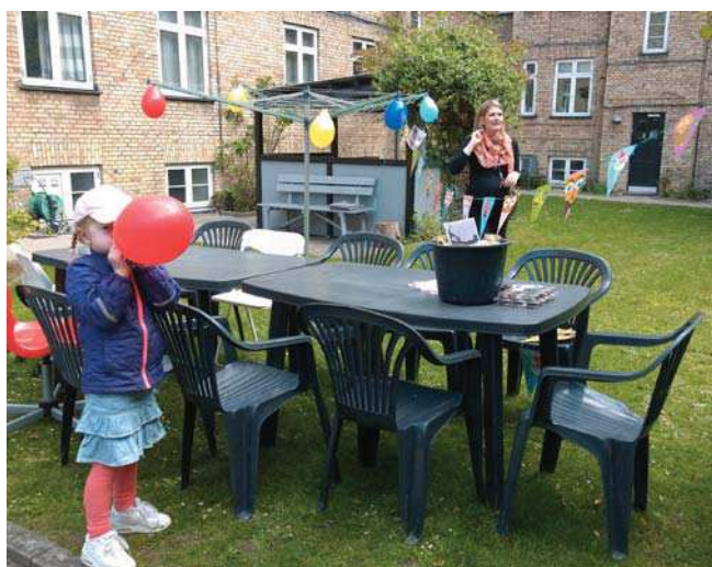
Inspiration til den fremtidige gårdhave