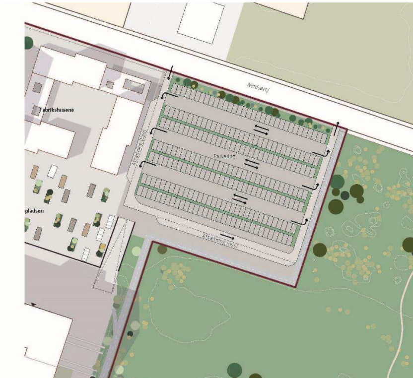
Figur 3 Forslag til parkering på terræn incl. af-/ og påsætningspladser for taxa og busser.