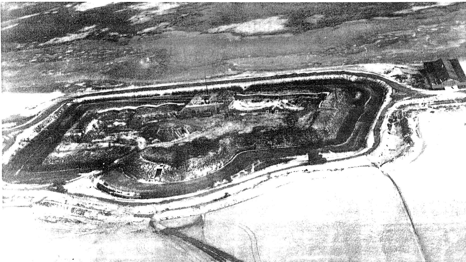
Strickers Batteri set fra vest, til højre ses de to briske, hvor 35½ cm kanonerne stod, 1933.

Batteriet blev opført på Amagers østkyst ved Christianshavns Fælled, senere Kløvermarken, i 1801. Det indgik som det sydligste led i Københavns Søbefæstning, der desuden bestod af Kastellets søbatterier, Trekroner, Batteriet Sixtus, Christiani Quinti Bastion og Christiani Quinti Lynette. Det kaldtes oprindeligt Christian VI's Batteri, senere ses det omtalt som Amager Batteri og Kastrup Batteri, men fra 1807, da der bliver bygget et batteri i Kastrup, omtales det som Strickers Batteri.