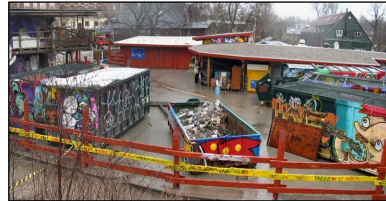
Christianias nærgenbrugsstation har sit eget tilpasset udtryk