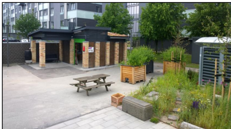
Den sociale nærgenbrugsstation i Hørgården, som har integreret et grønt byrum og plantekasser, og som har en åben plads der bruges til genbrugsaktiviteter for kvarterets børn og unge