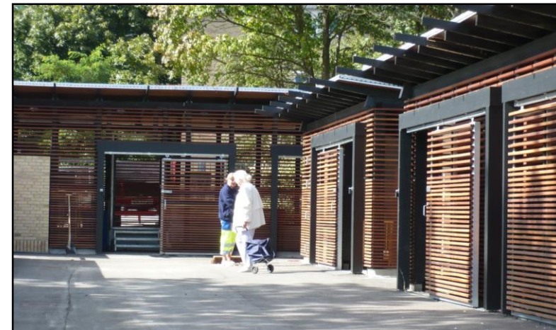
Nærgenbrugsstationen i Tingbjerg