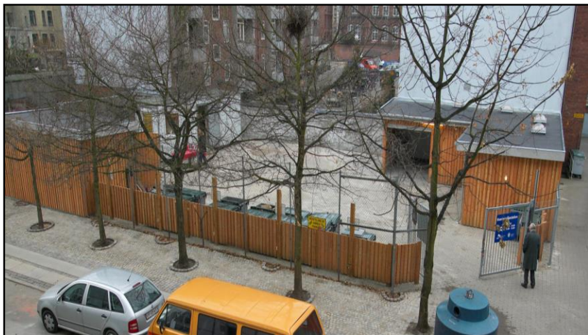
Nærgenbrugsstation i Gartnergade på Nørrebro, hvor byttefaciliteterne er hyppigt besøgt