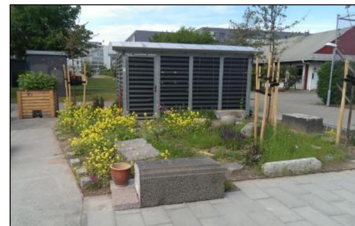
Plantekasser og byhave som beboerne passer