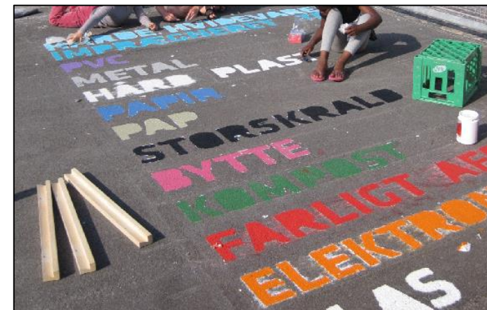
Børn involveres i udsmykning