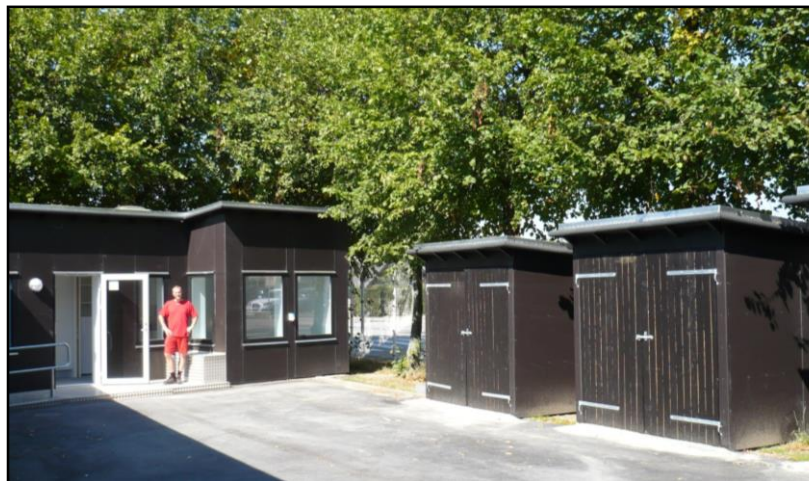
Nærgenbrugsstation i Haraldsgade, som ligger på et område for almene boliger