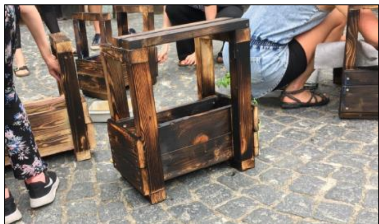
Workshop: Lav plantekasser af genbrugstræ