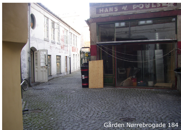
Gården Nørrebrogade 184

Overflader og belægninger er generelt hullede og nedslidte. Dette gælder i særlig grad arealet tilhørende ejendommen Ægirsgade 4-8.