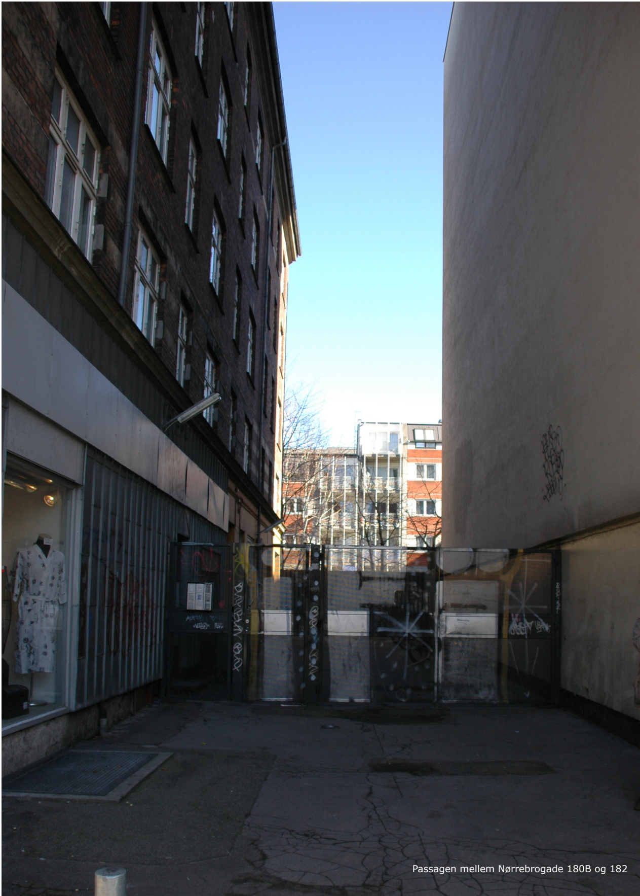
Passagen mellem Nørrebrogade 180B og 182