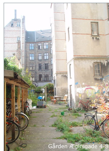
Gården Ægirsgade 4-8