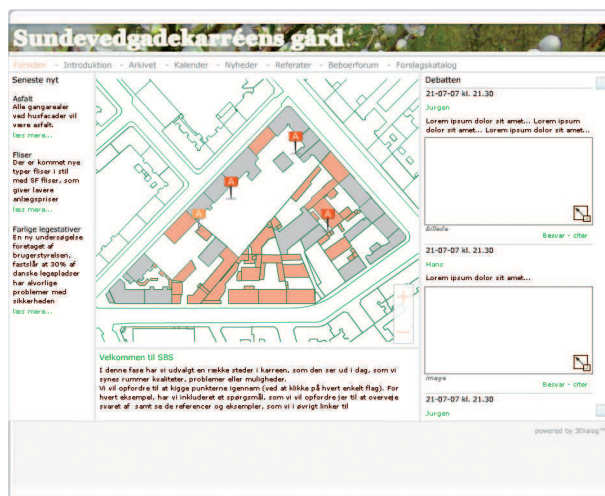
Eksempel på hjemmeside

På bestemte tidspunkter i processen kan beboerne debattere egne og andres forslag og synspunkter - med mulighed for bidrag fra eksempelvis landskabsarkitekt og øvrige eksterne parter.