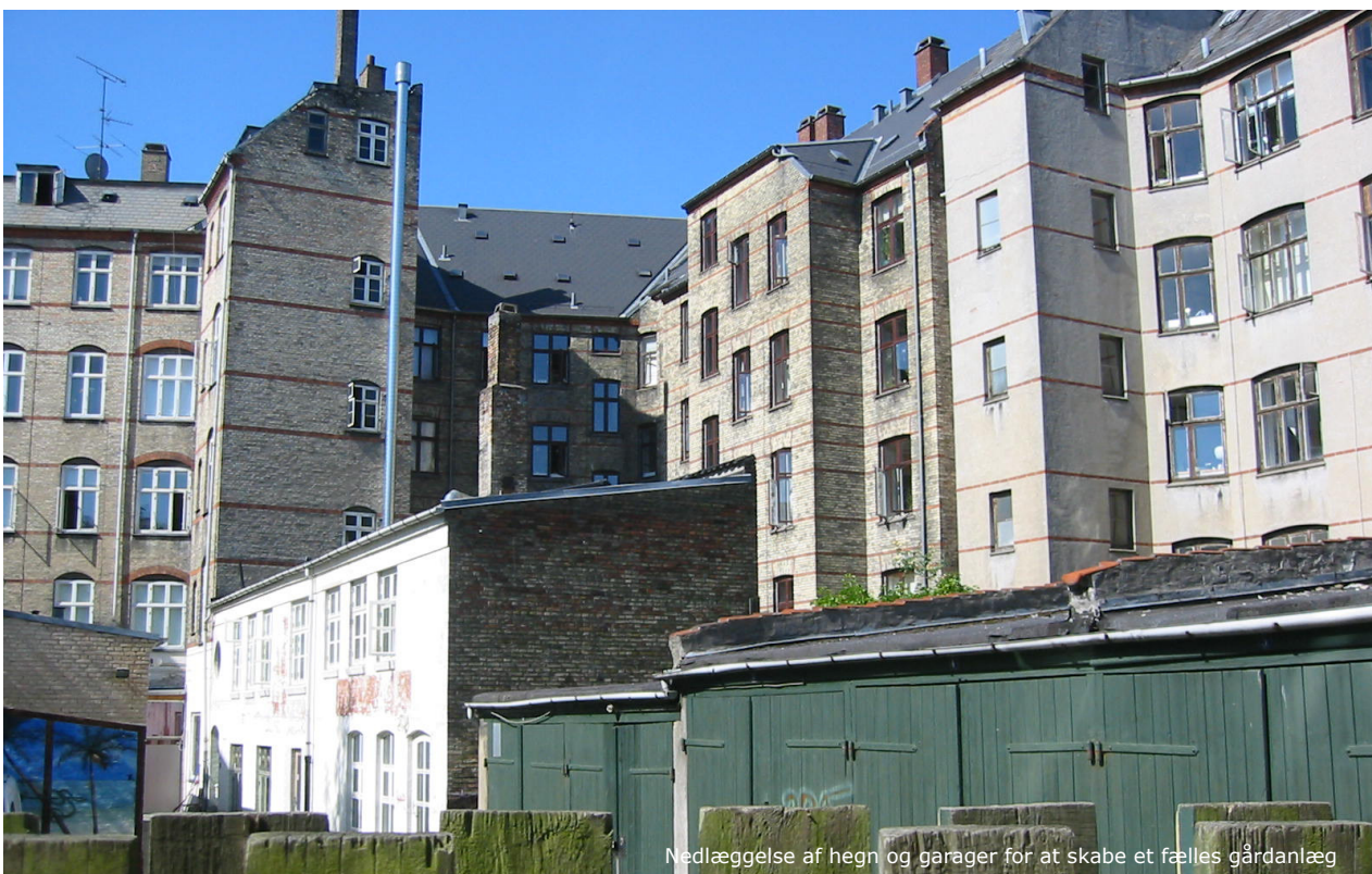
Nedlæggelse af hegn og garager for at skabe et fælles gårdanlæg

Beboerne vil få mulighed for at være med til at diskutere og komme med forslag til indretningen af det fælles gårdanlæg. Dialogen vil ske dels på gårdgruppemøder, dels på hjemmesiden og dels via et digitalt gårdrumsspil. Derfor er placering af aktiviteter i gården ikke udviklet eller indarbejdet på nuværende tidspunkt.