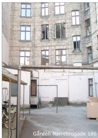
Gården Nørrebrogade 186