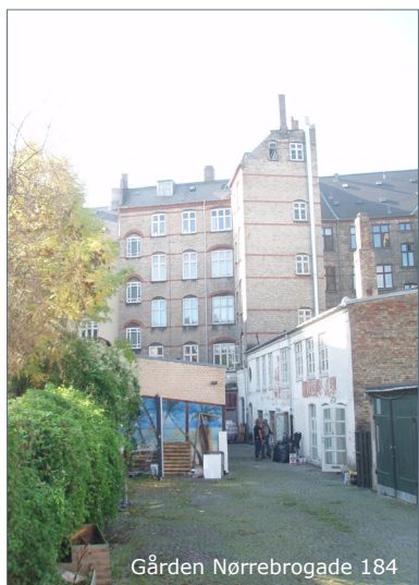
Gården Nørrebrogade 184

Forslaget omfatter rydning af udtjente belægninger og asfalt, skure og hegn. Forslaget omfatter endvidere nedrivning af baghuset til Nørrebrogade 184, der anvendes som lager. Bygningen er en muret bygning i 1 etage.