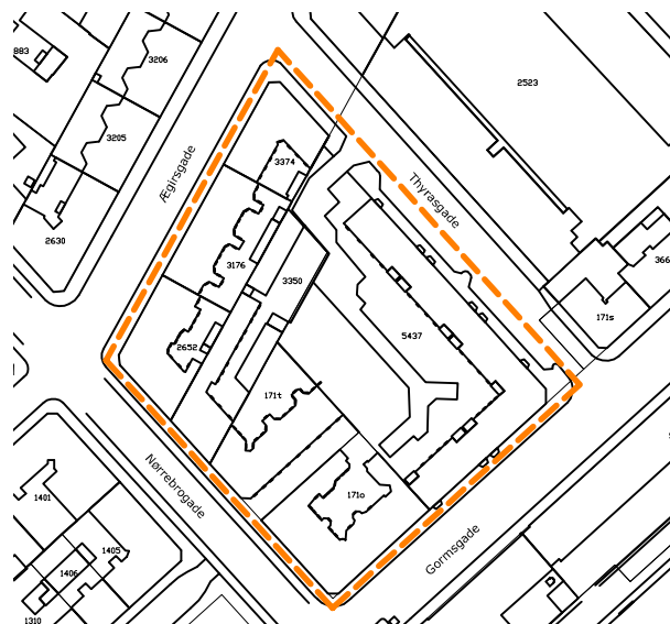
kort over Thyrasgade-karreén

Thyrasgade-karréen omkranses af Thyrasgade, Gormsgade, Nørrebrogade og Ægirsgade, og omfatter ejendommene Thyrasgade 1-11, Gormsgade 1-7, Nørrebrogade 180A-186 og Ægirsgade 2-10, alle beliggende 2200 København N. Med dette forslag foreslås der etableret ét samlet fælles gårdanlæg for karréen.