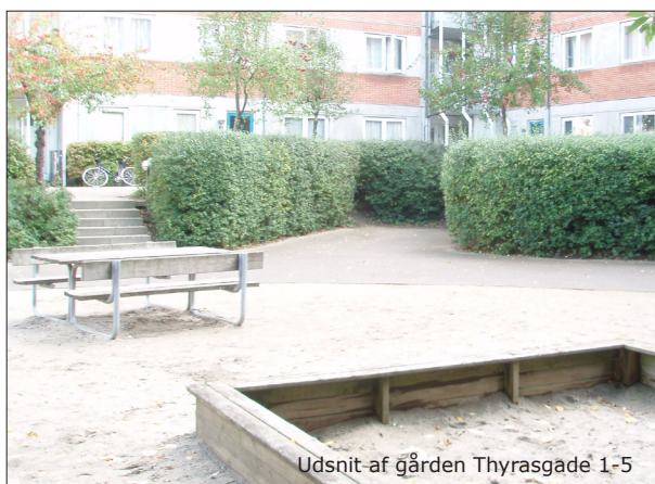
Udsnit af gården Thyrasgade 1-5

Når byfornyelsesbeslutningen er truffet, tinglyses beslutningen på karréens ejendomme. Indholdet af beslutningen er bindende for ejere og indehavere af andre rettigheder over ejendommene fra det tidspunkt, de pågældende har fået meddelelse om vedtagelsen, uden hensyn til, hvornår retten er stiftet.