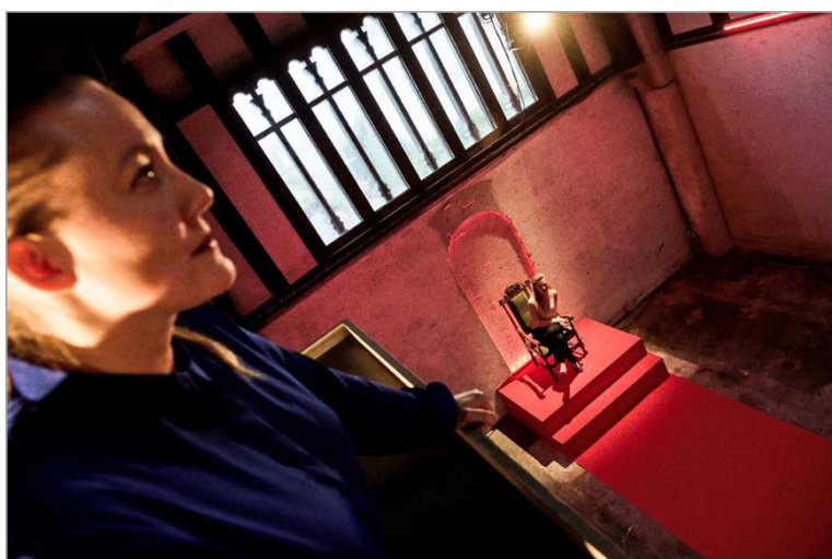
Forestillingen: MARIA STUART

I det hele taget har Sydhavn Teater vokseværk og en renovering af Østre Kapel ville derfor også understøtte vores virke som lille storbyteater under Københavns Kommune.