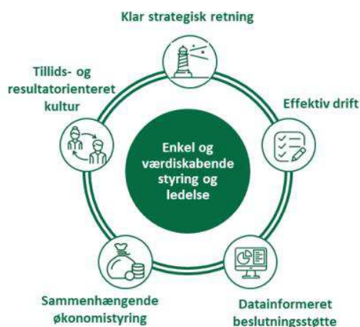
Figur 1. Enkel og værdiskabende styring og ledelse – fem dimensioner.

De fem dimensioner hænger sammen og understøtter hinanden, jf. figur 1. Når de tænkes sammen, bidrager det til at skabe en solid styring, der gør det muligt at foretage de prioriteringer, der skaber mest værdi for institutionens kerneopgaver.