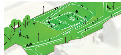
- og indbyder både til offentlige og private begivenheder