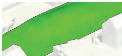
- En forhøjning i De grønne bakker