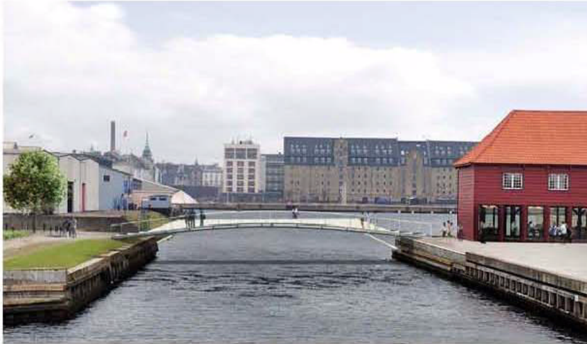
Set fra Frederiksholmsbroen