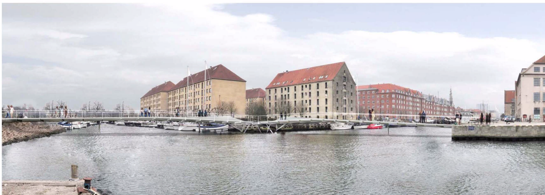
Set fra Christiansholm mod Trangraven og Christianshavns Kanal