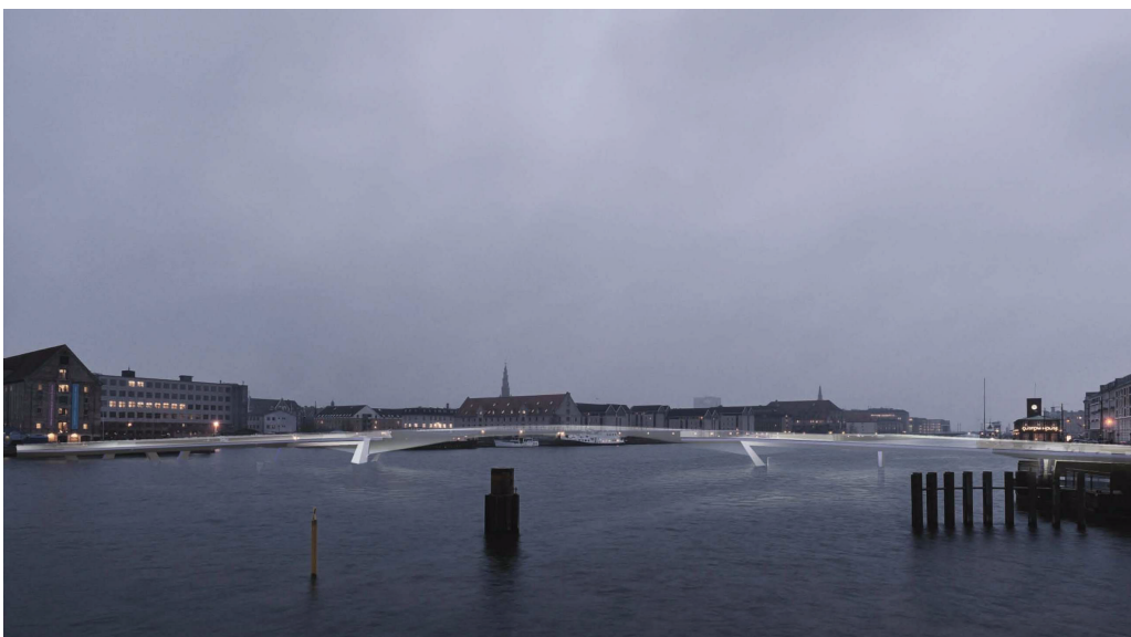
Broen set mod syd, aften