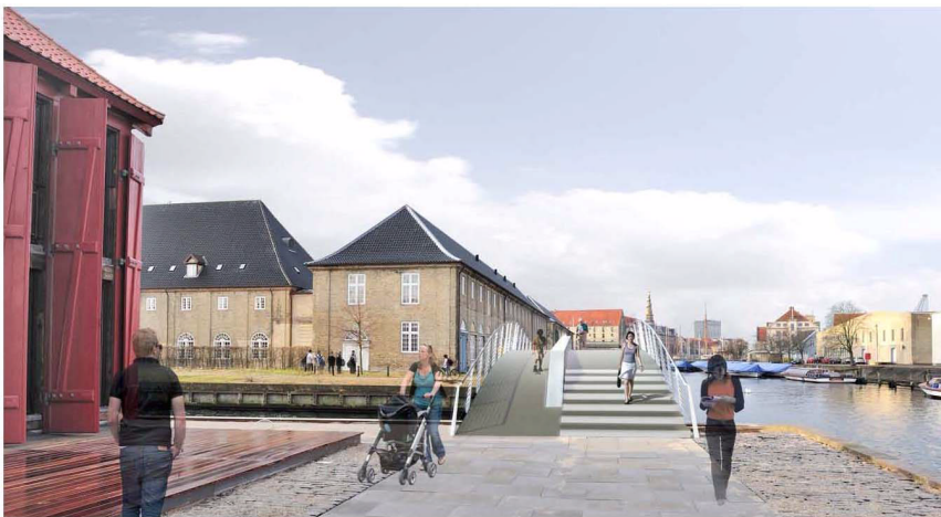
Set fra Masteskurene mod Forsvarets Søarsenal mod syd