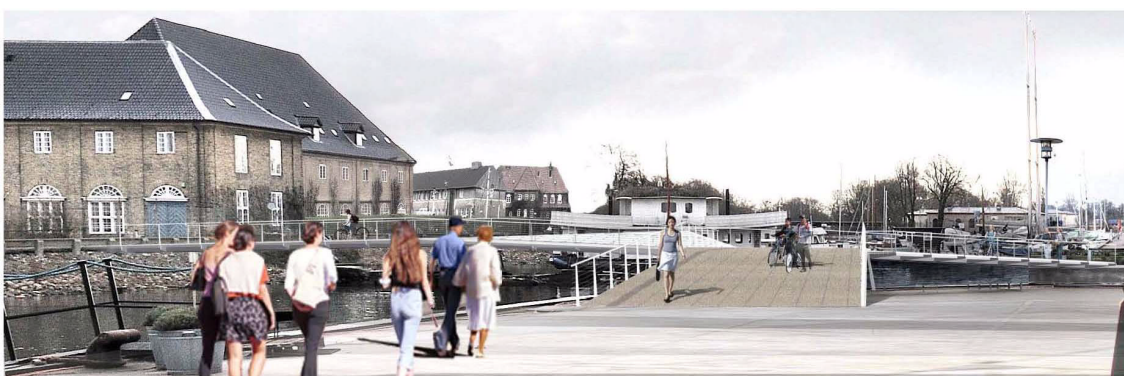
Set fra Grønlandske Handels Plads mod Trangraven