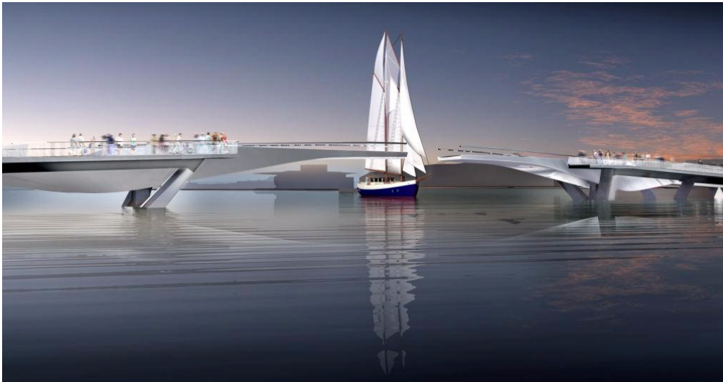
Broen set mod nord