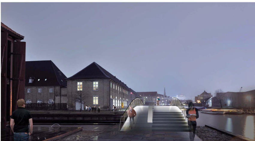
Som ovenstående, aften