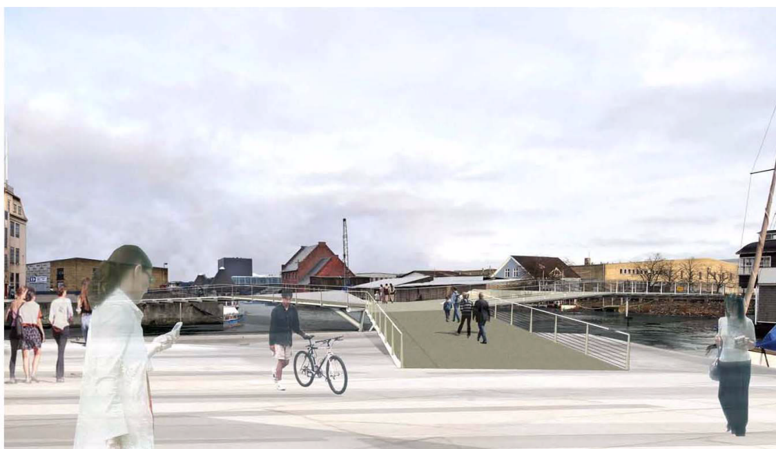
Set fra Islands Plads mod Christiansholm