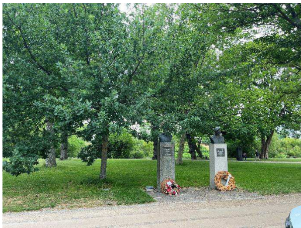
Fotos af nuværende gruspladser langs Amaliegade med buster af tre krigshelte: Anders Lassen, Kai Birksted og Thomas Dinesen

Fra Københavns Kommune, TMFKP beskyttelseslinjer, har vi fået tilsagn om at kunne placere et mindesmærke på den tomme plads ved siden af Thomas Dinesen i Churchillparken, koordinater 55,68897 N, 12,59778 Ø. Vi er indforstået med, at det kun vil være muligt at dispensere fra fortidsmindebeskyttelseslinjen, hvis bustens omfang svarer til de eksisterende tre buster og at omfanget er tilpasset omgivelserne.