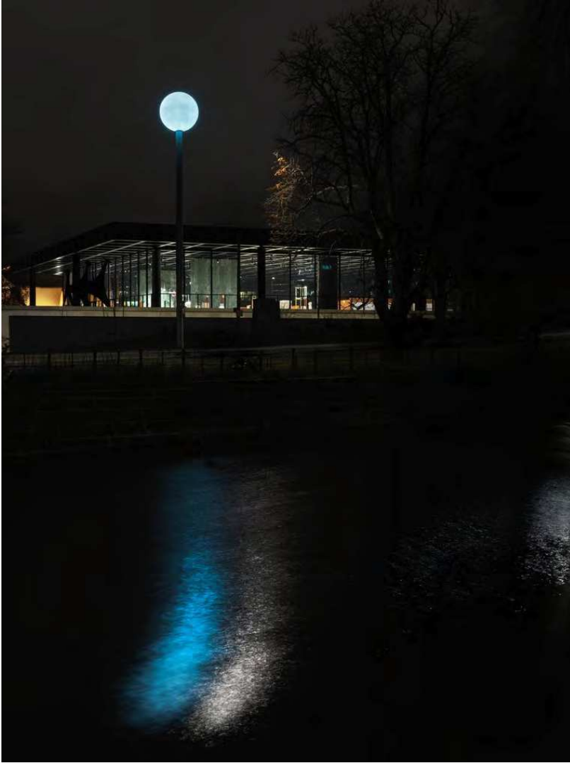
Isa Genzken Vollmond foran Neue Nationalgalerie, 2023