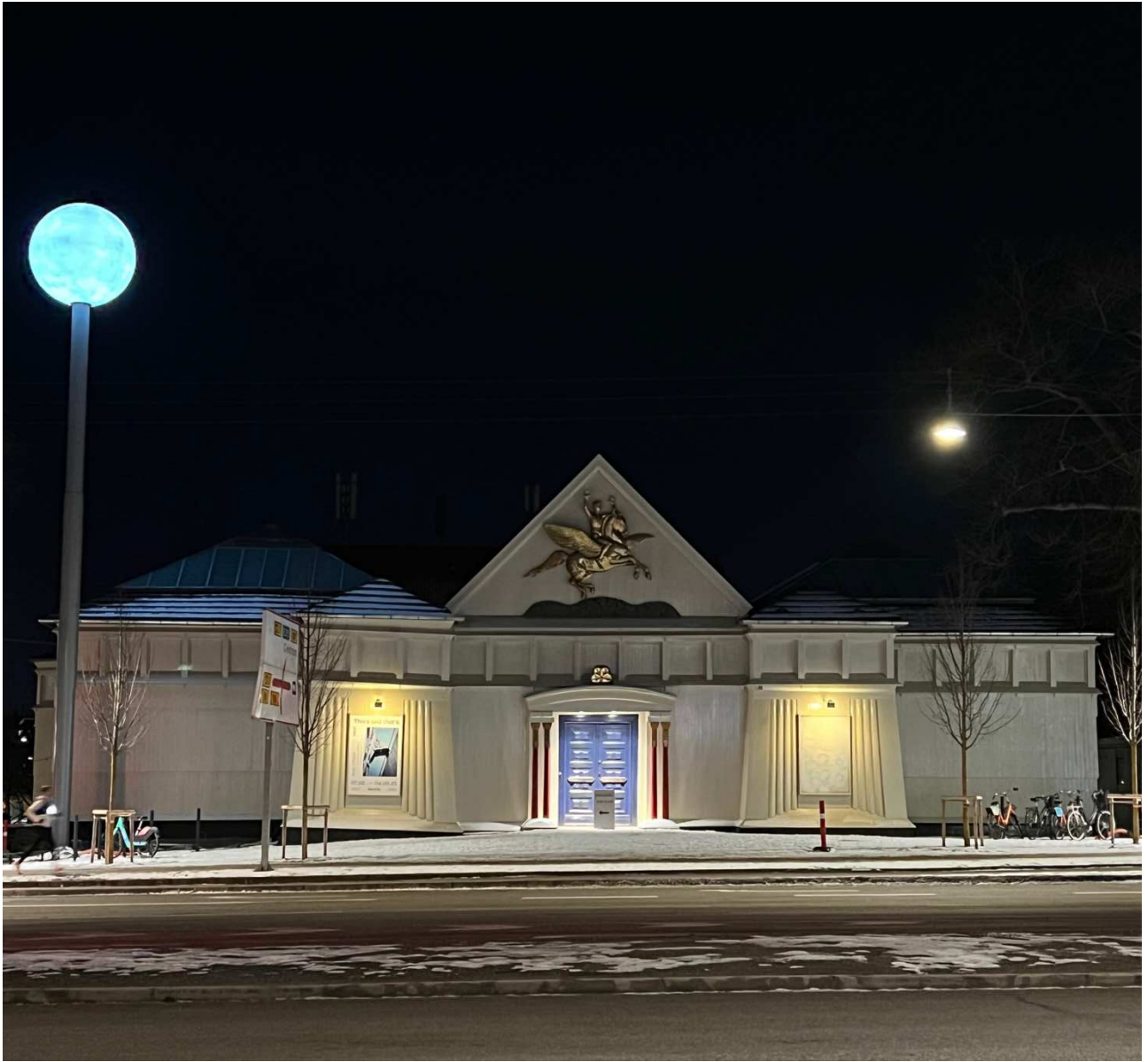
Billedmateriale, Isa Genzken Vollmond foran Den Frie