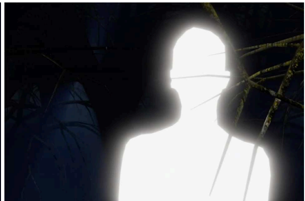
Noah Holtegaard (detajle fra videoværket Glimmerstøv ), dengang jeg blev mig , Udstillingsstedet Q, København, 2023