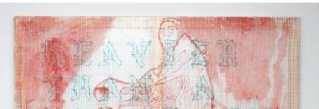
Ihsan Saad Ihsan Tahir, أختفوا وراء الشمس (They Disappeared Behind the Sun), All all all, København

At Elijah Mesayer 10.12.23 Julkalender Article in English