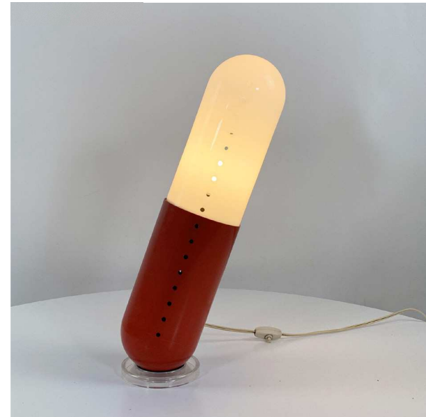
Referencebillede til foldemadras og Cesare Casatis Pillola-lampe fra 1968.