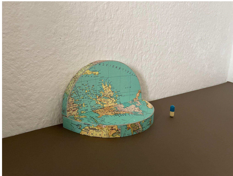
1:10 papmodel af foldemadras og pillelampe.