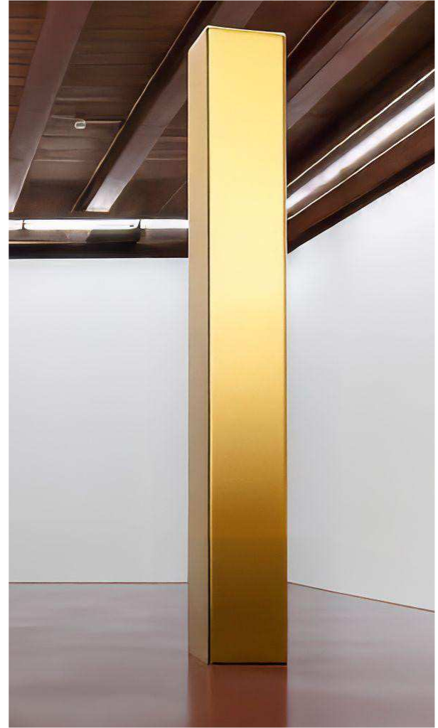
Søjlen før og efter messingkonstruktionen der måler 45x45x400 cm.