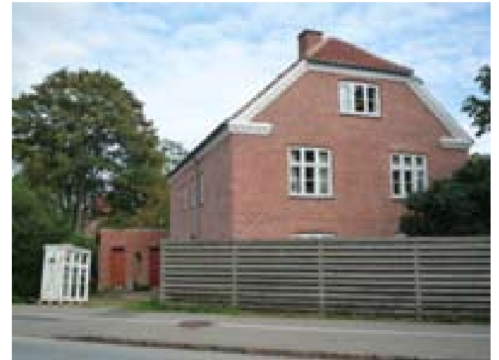
Hus i Brønshøj.

Som det er beskrevet i projektansøgningerne til de bevilgende puljer og fonde handler jagten på det røde hjem om mere end selve konkurrencen om en energioptimering af det vindende hus og gennemførelsen af fire temaaftener. Den anden halvdel af projekt handler om at komme i tæt dialog med husejerne og skabe hvad man kan kalde et 'forum for interesse-koordinering'. Konkret betyder det et internetforum (vi forestiller os skal hedde 'Hus med omtanke' efter informationsmaterialet af samme navn) skal kunne fungere som