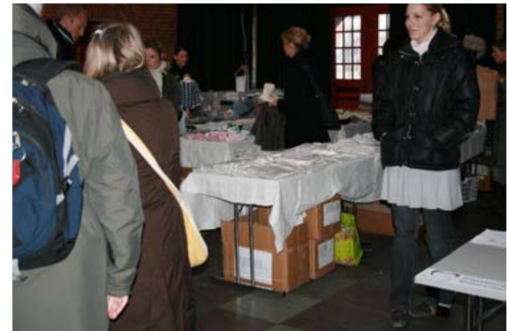
Baby og Kemi - arrangement i Lygten Station