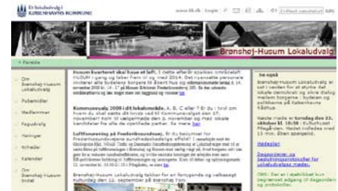
I 2010 skal Brønshøj-Husum Lokaludvalg i gang med Bydelsplanen

Målgruppe: Alle borgere i Bispebjerg, Brønshøj- Husum med interesse for indkøbsmuligheder.