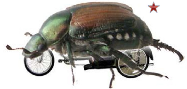
Hvordan kommer Mobillen til at se ud?

Målgruppe Folk der bor i hus i vores distrikt.