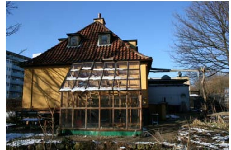
Karens Hus, februar 2009.