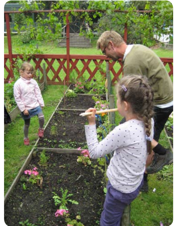
Skrammellegepladsen i Emdrup.