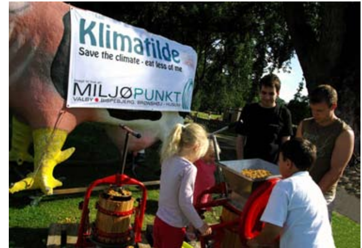
Gang i mostpressen i Lersøparken,.

Der skal søges midler eksternt til honorar for at kunne gennemføre projektet.