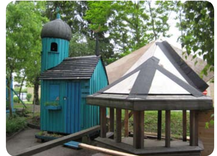
Skrammellegepladsen i Emdrup

Materialer: ”Hus med omtanke” og energikuffert