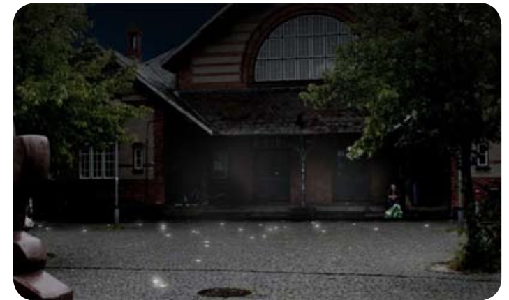
Visualisering af solcellelys på Lyngsies Plads