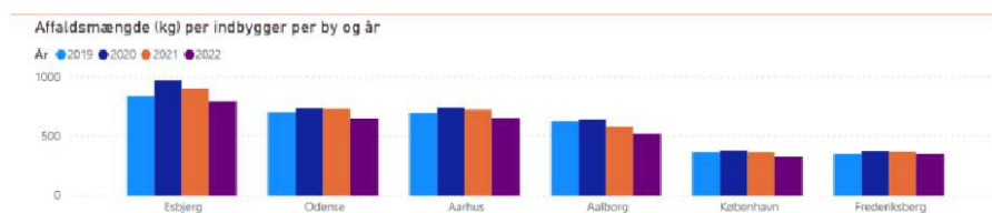
Figur 1. Total affaldsmængde, affaldsmængde per husstand og affaldsmængde per indbygger for årene 2019-2022, for de seks udvalgte byer. Data er hentet på Affaldsviden.dk.

Forslag: Vi mangler affaldstal på bydelsniveau i København. Det håber vi bliver en mulighed i planperioden, meget gerne helt ned til gårdniveau.