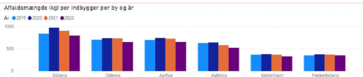
Figur 1. Total affaldsmængde, affaldsmængde per husstand og affaldsmængde per indbygger for årene 2019-2022, for de seks udvalgte byer. Data er hentet på Affaldsviden.dk.

Københavns affaldsmængder pr. borger er meget lavt. Gennemsnittet er 754 kg i 2021 for Danmark mens en Københavner i gennemsnit producerer 334 kg.