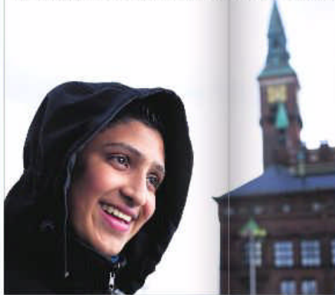
...højt en... højt en... højt en... højt en...