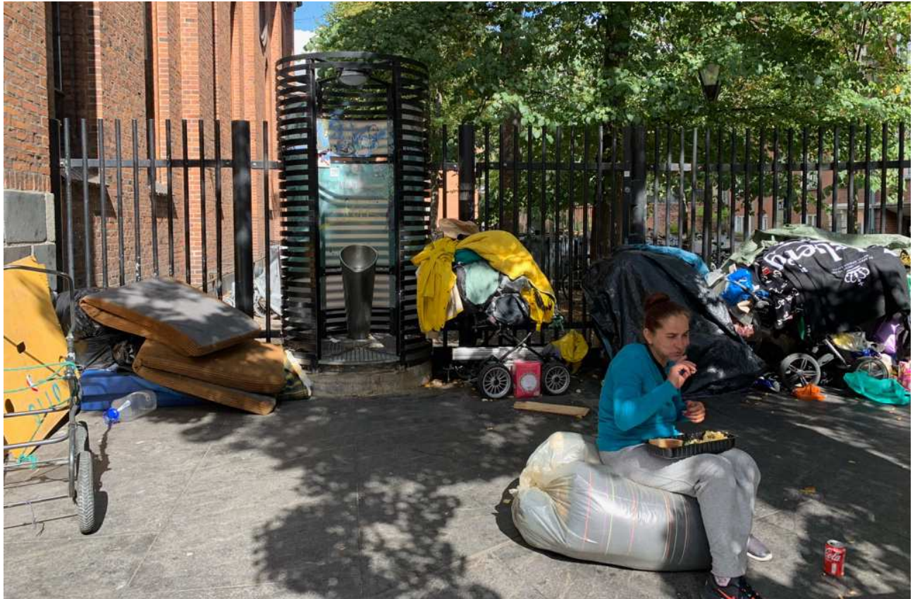
Kommunens areal og pissoir ved indgangen til Mariatjenesten.

På grund af de skiftende målgrupper af samfundets absolut svageste, som Mariakirken tager sig af, skal pladsen også fungere til evt. fremtidige grupper og hele lokalområdet.