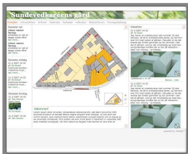
Visning fra foreløbig hjemmeside