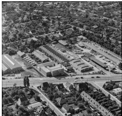
Danmark set fra luften, 1958.