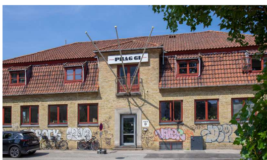
Prags Boulevard 61