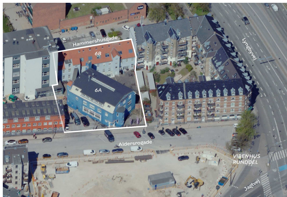
Området set mod nord. Lokalplanområdet er indtegnet med hvid linje, og de vigtigste gader, pladser og bygninger er navngivet.

Området omfatter de to adresser Aldersrogade 6A, matr.nr 3836, Udenbys Klædebo Kvarter og Aldersrogade 6B, matr.nr. 3836, Udenbys Klædebo Kvarter, der begge er tidligere industri- og erhvervsjendomme. Ejendommene ligger i et kvarter, der ellers er præget af industribygninger og etageboliger fra tidligt 1900-tallet og mellemkrigstiden.