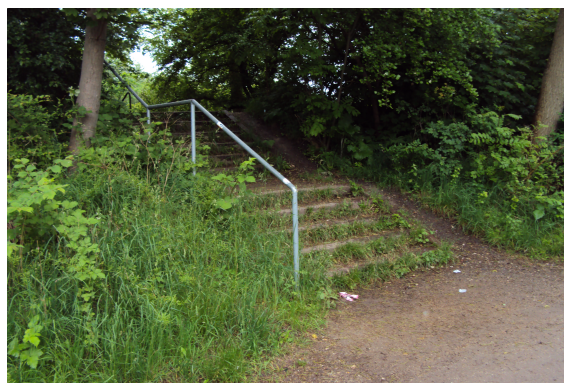
Linieføring Kommuneplan -volden set fra nordsiden

Forvaltningens anbefalede forslag til linieføring udnytter et eksisterende gennembrud i volden og vurderes i mindre grad at genere Christianias beboere langs Dysestien. Den nye placering af krydsningen af Kløvermarksvej er desuden placeret, hvor der er bedre oversigtsforhold for cyklister og gående, der skal krydse den tungt trafikerede Kløvermarksvej.