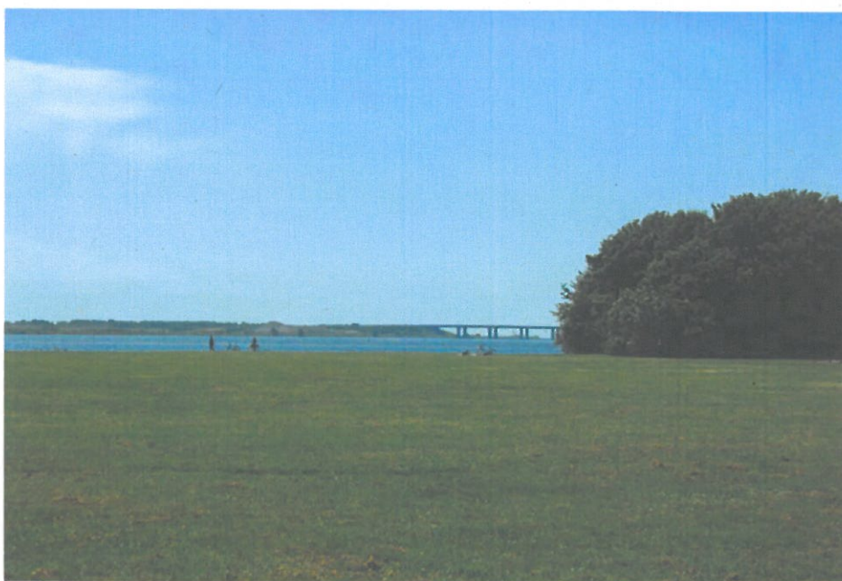
Figur 6-10 Udsigt fra Valbyparken mod broen til Avedøre