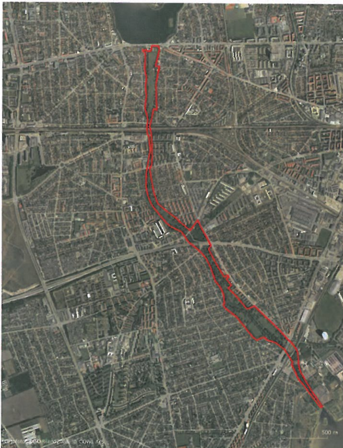
Figur 6-16 Vigerslevparken

Parken, der er et ca. 4 km langt grønt område, dækker et areal på ca. 45 ha. Parken er præget af ganske få vegetationstyper. Det er især fuldt udvoksede busketter og store plæner med fuldkronede træer. Der er derfor i 2006 rejst en ny fredningssag, som omfatter en samlet fredning af Vigerslevparken, inklusiv Københavns Kommunes del, arealer i Hvidovre Kommune samt Damhussøen, Damhusengen, Krogebjergparken og Grøndalsparken inklusiv Københavns Kommunes og arealer i Frederiksberg Kommune.