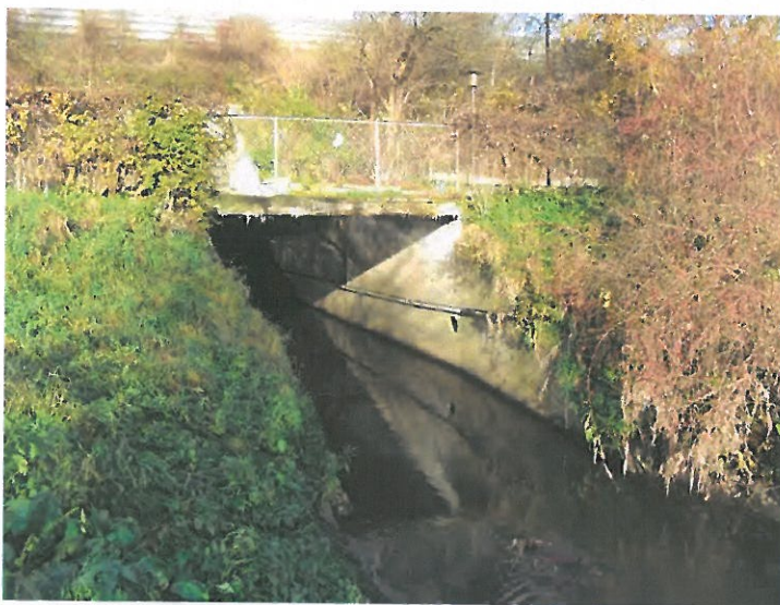
Figur 6-19 Harrestrup Å ved krydsning med jernbanen. Her kan der etableres banketter til faunaen.