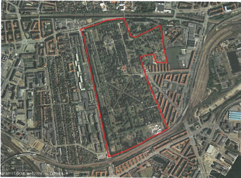
Figur 6-13 Vestre Kirkegård

Vestre Kirkegård er Danmarks største kirkegård, med et areal på omkring 54 hektar. Den blev anlagt i 1870, og er blevet udvidet flere gange. Mod Sjælør Boulevard står der en imponerende række af popler. Den øvrige kirkegård er præget af de smukke og monumentale alleer af lind, der opdeler de enkelte kvarterer.