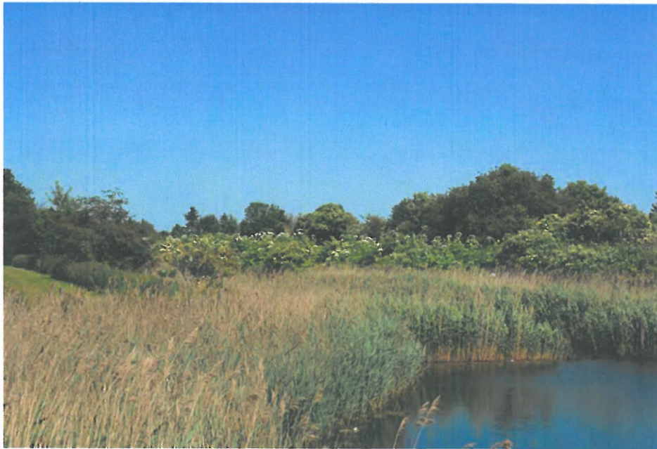
Figur 6-11 Store bestande af den invasive kæmpe-bjørneklo er et problem i randzonerne af Valbyparken