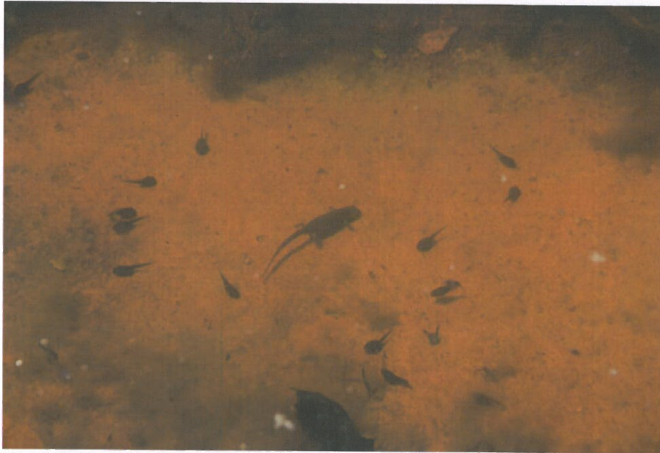
Figur 6-15 og i bassinet er der og et mylder af lille vandsalamander og skrubtudsehaletudser