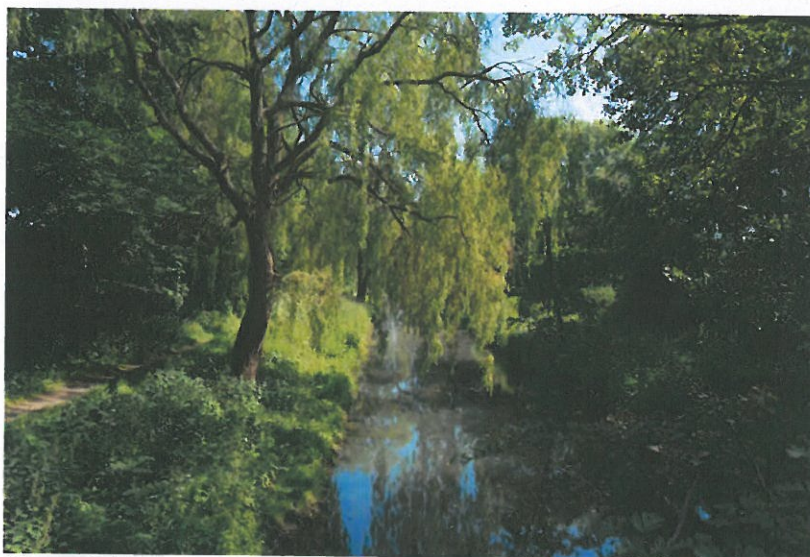
Figur 6-17 Harrestrup Å løber gennem Vigerslevparken.