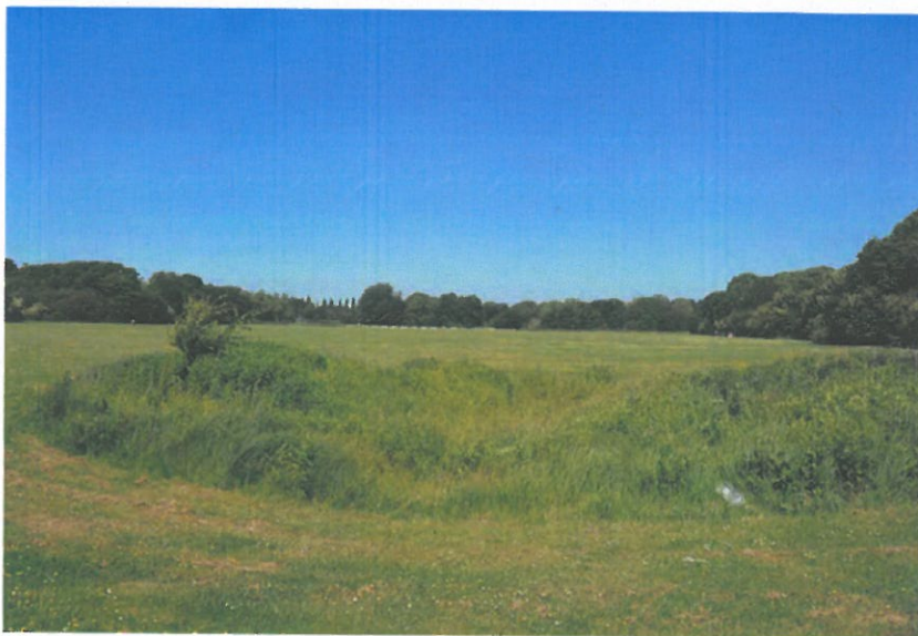
Figur 6-12 Udtørret vandhul (utæt lermembran) i Valbyparken