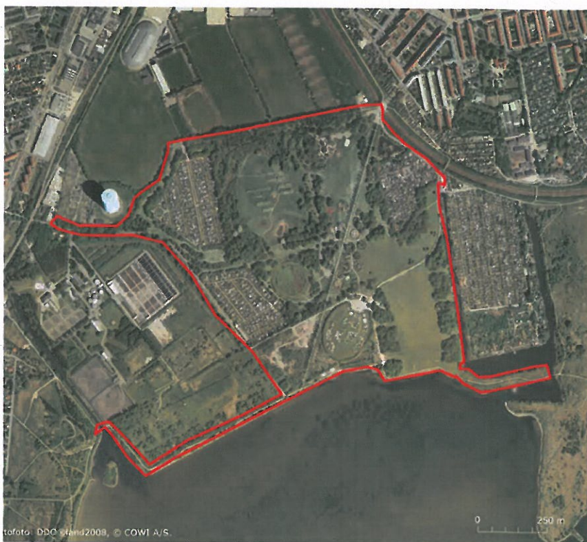
Figur 6-9 Valbyparken

Valbyparken er en af Københavns yngste parker. Den ligger på den gamle Valby Fælle, som var en lavliggende strandeng langs Kalveboderne. Hele fælleden havde siden 1913 været anvendt til losseplads. I 1937 ophørte lossepladsdriften på en mindre del af området. Affaldsdyngerne havde nu gjort området en del højere og dermed mindre udsat for oversvømmelse. Borgerrepræsentationen besluttede derfor, at der skulle anlægges en park på det frigivne lossepladsareal. Parken skulle tilgodese borgerne i de nye bydele Valby og Kgs. Enghave. Oven på affaldet blev lagt kloakslam, aske og muld. På størstedelen af arealet blev herefter sået græs, mens der langs parkens grænser blev plantet busketter og hist og her grupper af træer. Parkens areal er 64,2 ha. Den blev anlagt i perioderne 1937-39 og 1944-52. Parken blev fredet i 1966. Kysten langs Kalveboderne er omfattet af Kalvødkilefredningen af 1990.