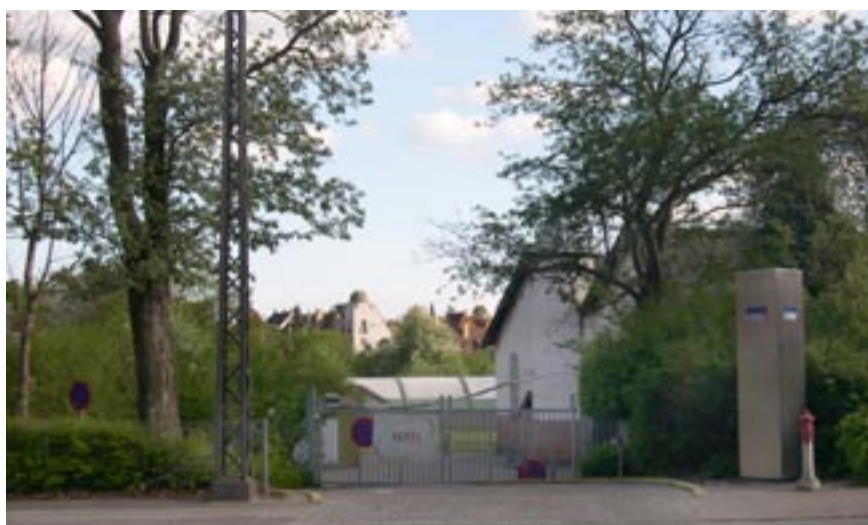
Adgangsvej til lokalplanområdet fra Hillerødgade.

Da genbrugsstationen skaber en trafikstrøm på ca. 1.000 biler heraf ca. 25 containertransporter om dagen, vil en vejadgang til genbrugsstationen over KPMG-grunden være at foretrække, da man hermed undgår støjgener for den eksisterende villabebyggelse. Denne løsning forhandles med KPMG, og hvis den ikke kan lade sig gøre, må vejadgangen til genbrugsstationen ske fra Hillerødgade. I indstilling om fredningsforslag for bl.a. Grøndalsparken, som Teknik- og Miljøudvalget har godkendt i mødet den 7. juni 2006 (TMU 326/2006) er der desuden knyttet den særlige bemærkning til bestemmelserne om Grøndalsparken: "At der kan etableres en adgangsvej fra en mulig genbrugsstation til Borups Allé