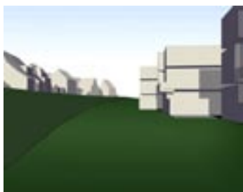
Volumenstudier, som i Model 1 (øverst) viser mulig boligbebyggelse i 3 etager. På grund af det skrånede terræn ligger den foreslåede boligbebyggelse lavere end villaerne på nabogrunden.

Genbrugsstationen dækker et areal på ca. 5.000 m 2 svarende til arealbehovet til 50-60 boliger. For at sikre bedre muligheder for en homogen og hensigtsmæssig bebyggelse i lokalplanområdet foreslås det i forbindelse med planarbejdet undersøgt, om genbrugsstationen kan placeres på "Trekantgrunden" ved Bispeengbuen, se luftfoto side 2. En forudsætning herfor er bl.a., at de kommunale arealer på dette sted kan udvides med tilgrænsende vejarealer langs Bispeengbuen samt eventuelt med et smalt bælte af Ringbanens arealer.