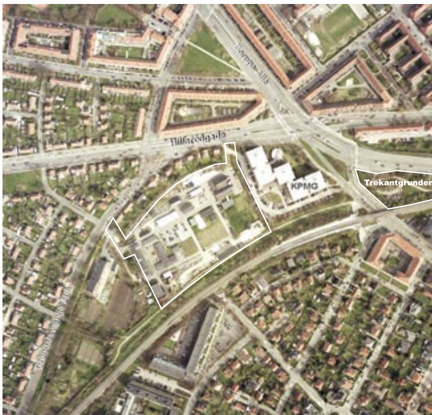
Luftfoto af lokalplanområdet og dets omgivelser optaget i 2005.