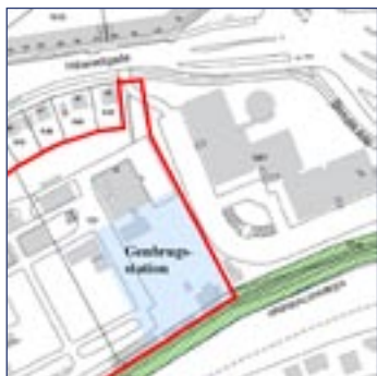
Genbrugsstationens beliggenhed er vist med lys blå signatur, lokalplanområdet med rødt.

De viste volumenstudier viser i ca. størrelser: