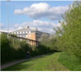
Lokalplanområdet til venstre bag det grønne hegn, set fra Grøndalsparken.