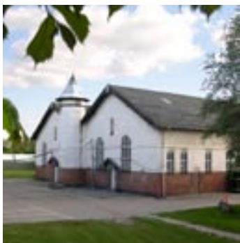
Den bevaringsværdige vandværksbygning set fra indkørsel ved Hillerødgade.