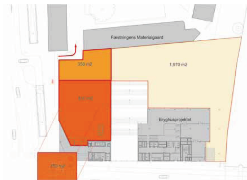
Større byplads med ét udvidet sikret område og fjernelse af legebakken.