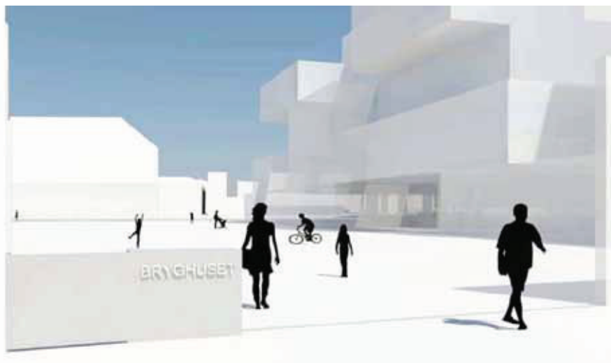
3d illustration, åbent hegn.