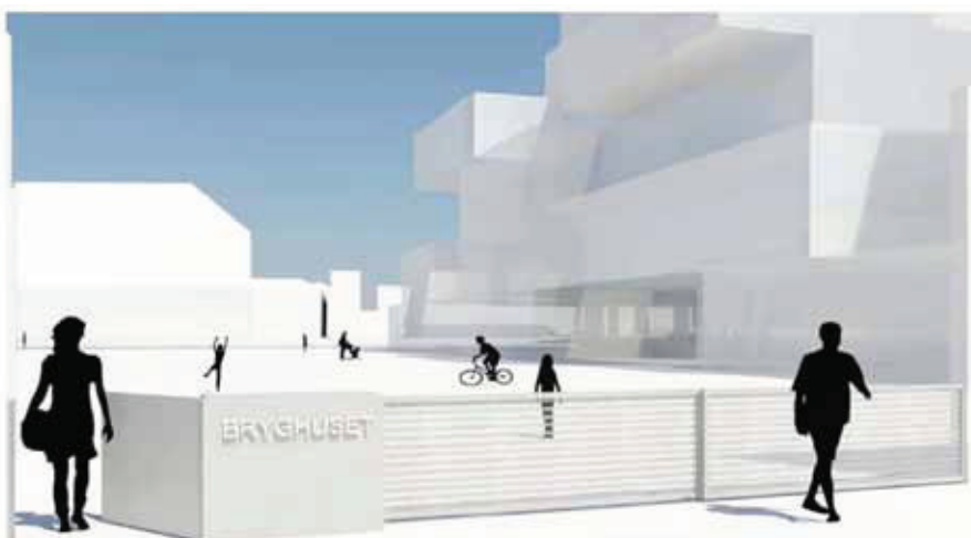
3d illustration, lukket hegn.