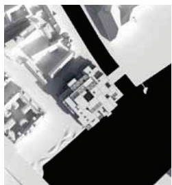
21. marts kl. 9.00 - Før

Sidste frist for indlevering af indsigelser og/eller ændringsforslag til den supplerende høring er den 8. juni 2009.