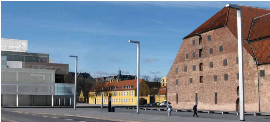
Til venstre ses bebyggelsens front og passage langs havnen som i lokalplanforslaget og til højre efter bebyggelsens flytning og justering af facader og havnepassage. I baggrunden skimtes Knippels Bro. Havnepassagens bredde udfor stueetagens udkræning er øget fra 3 til 5 m. Resten af passagen er ca. 9 m bred. Passagens afgrænsning langs havnen flugter med den udkragede facade fra 1. sal og opefter.

Der er ingen ændringer i forslag til kommuneplantillæg.