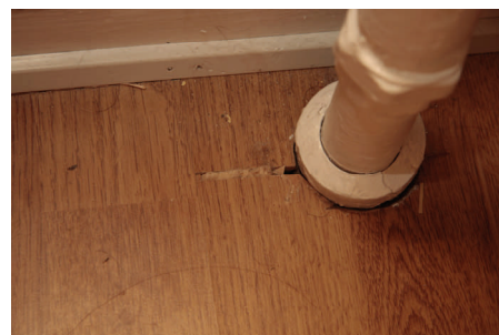
Kiler nedsat som forsøg på at holde gulvet samlet.