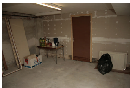
Sådan ser vores omklædningsrum ud i øjeblikket