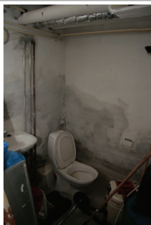
Vores toilet faciliteter - heldigvis må vi låne naboens toilet