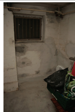
Sådan ser vores instruktøromklædning ud lige nu