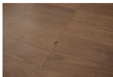
Samling som er gået lidt i stykker og folk kan rive sig på.