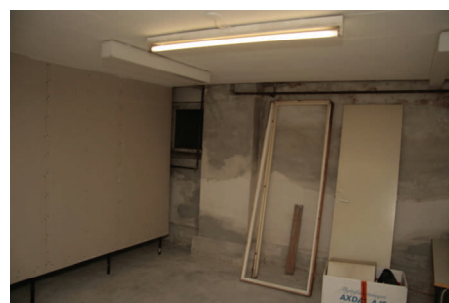
Omklædningsrum fra anden vinkel