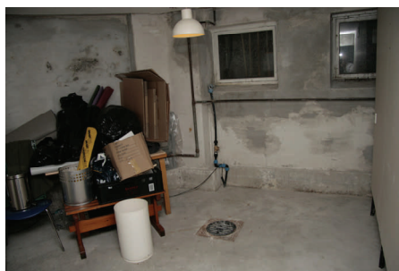
Sådan ser vores opholdsrum ud i øjeblikket