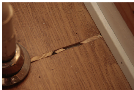
Kiler nedsat som forsøg på at holde gulvet samlet.