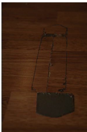
Samling som er gået meget i stykker og som er dækket til med gaffa-tape.