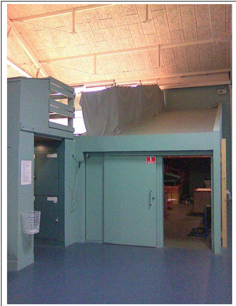
Foto af redskabsrummet, der er placeret til højre for squashbanerne. Klublokalet kan etableres ovenpå rummet, der dermed giver et perfekt overblik over squashbane 14.