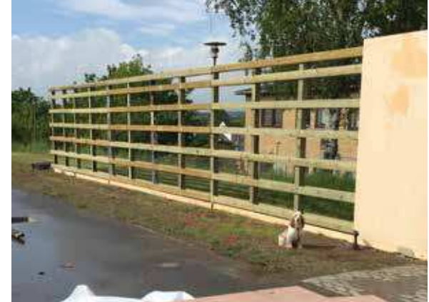
NÆSTVED HØJE PLADS