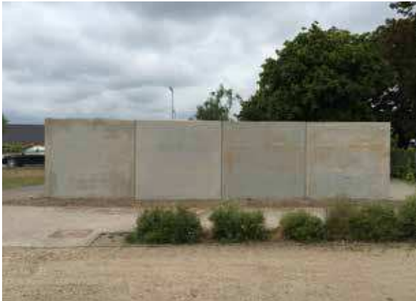
NÆSTVED HØJE PLADS