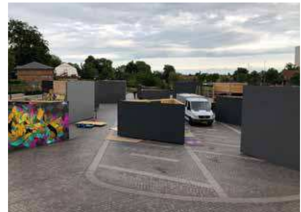
NÆSTVED KUNSTBY FESTIVAL 2022