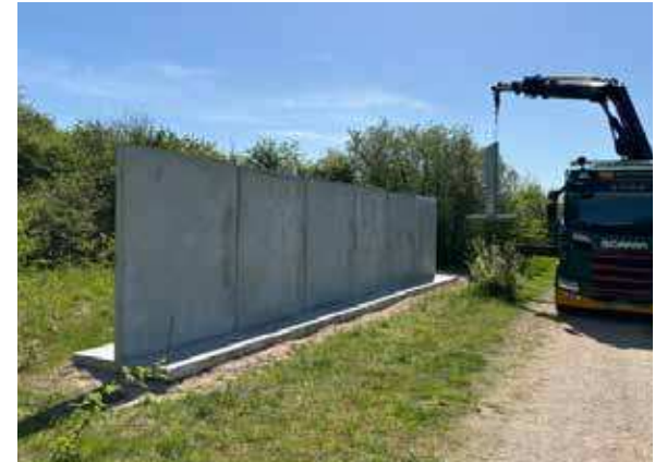
MUSICON ROSKILDE KUNSTPARK