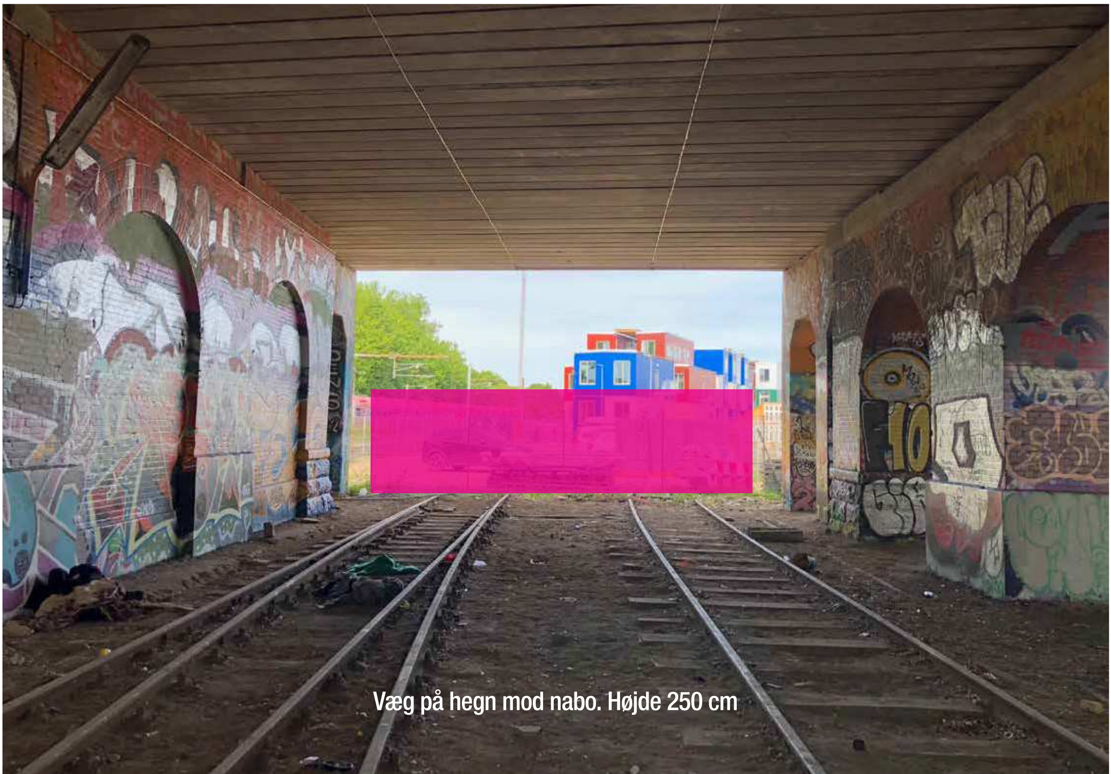
Væg på hegn mod nabo. Højde 250 cm