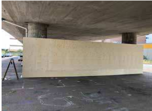
HELSINGBORG - GÅSEBECH GRAFFITIPARK