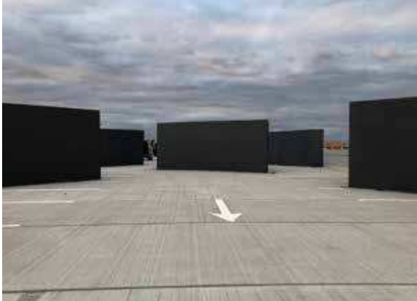
NÆSTVED NÆVERLAND 2020