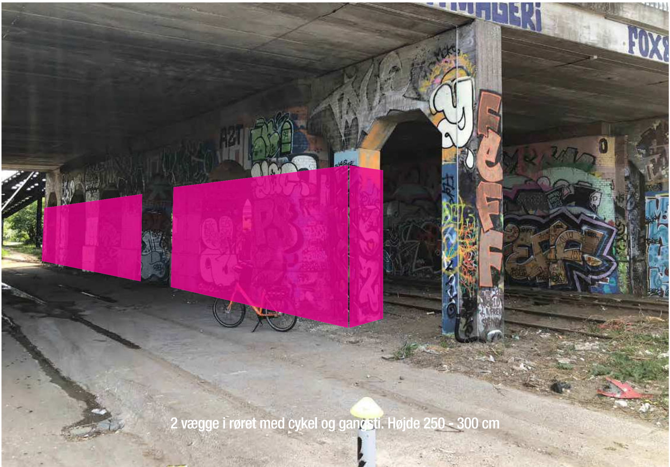
2 vægge i røret med cykel og gangsti. Højde 250 - 300 cm