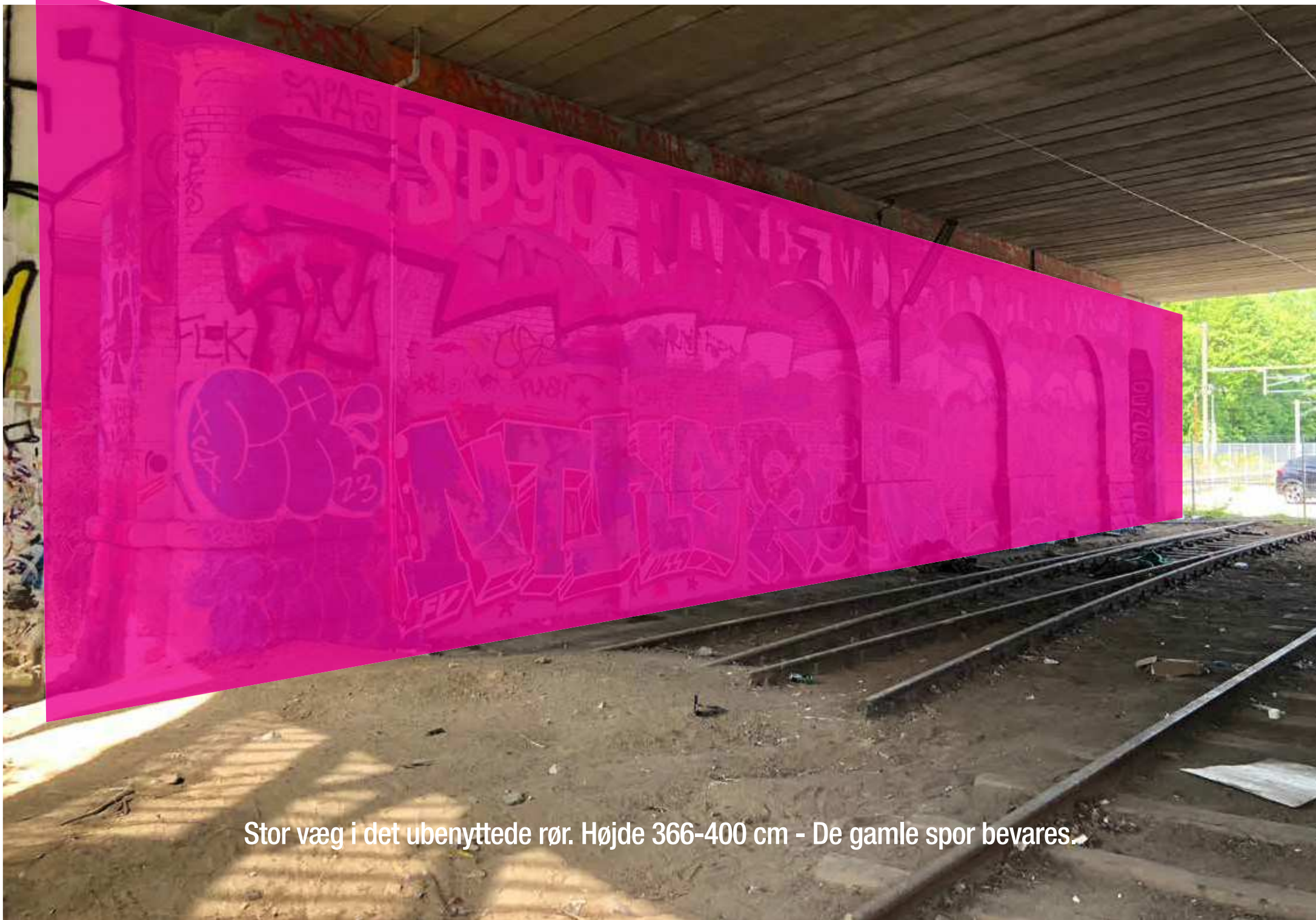
Stor væg i det ubenyttede rør. Højde 366-400 cm - De gamle spor bevares.