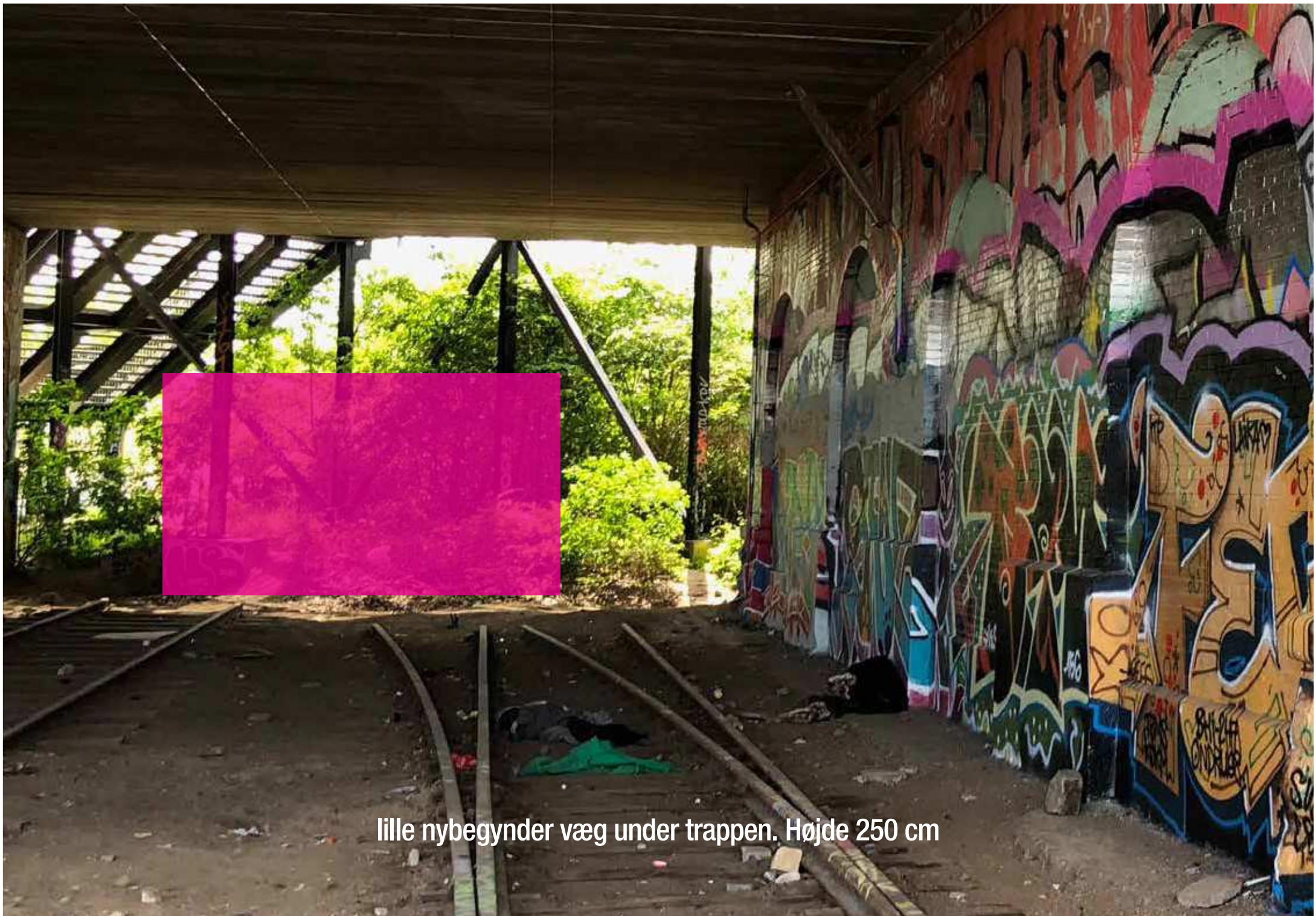
lille nybegynder væg under trappen. Højde 250 cm