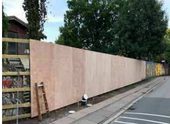
STADEN GRAFFITIVÆGGEN I PRINSESSEGADE