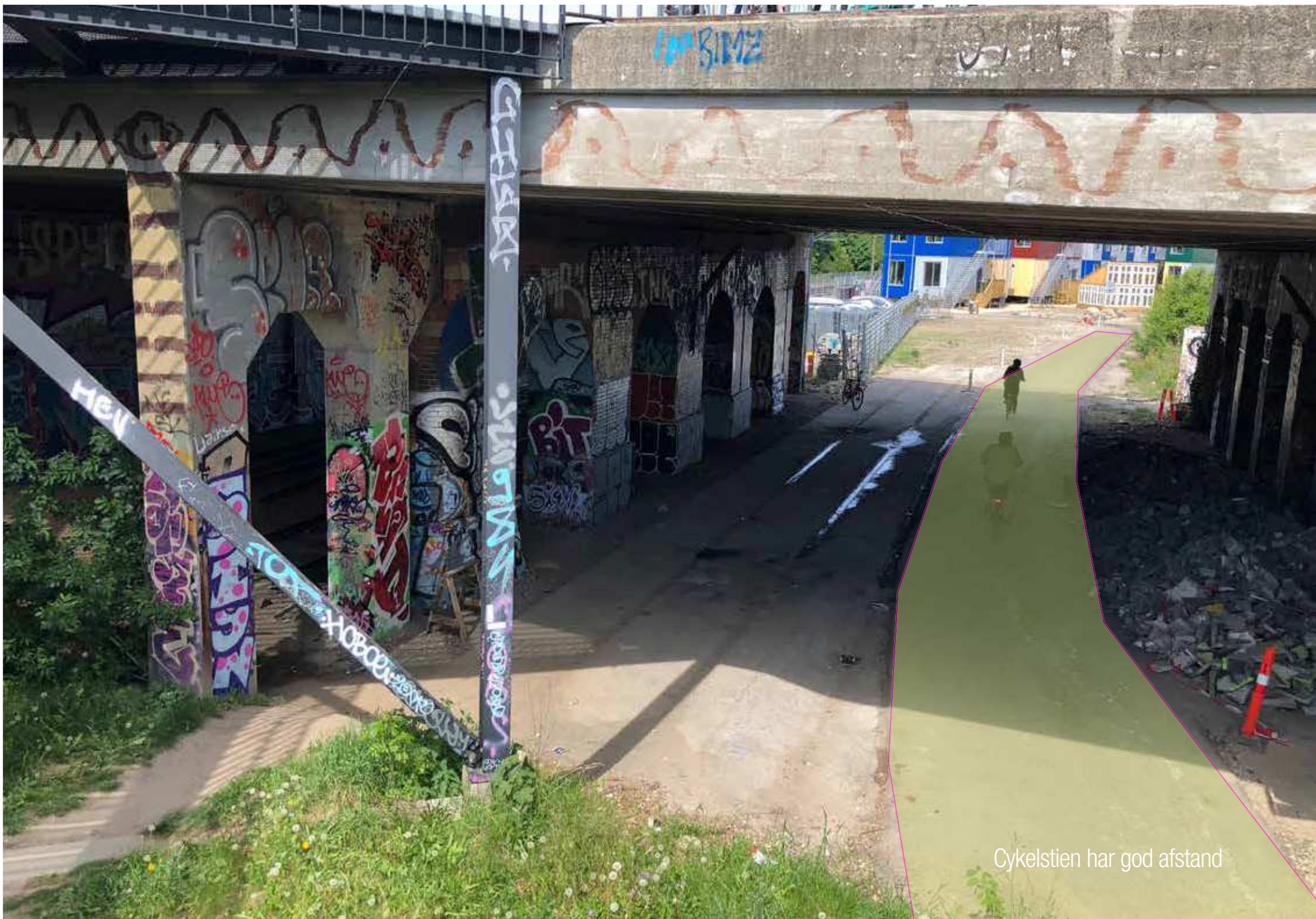
Cykelstien har god afstand