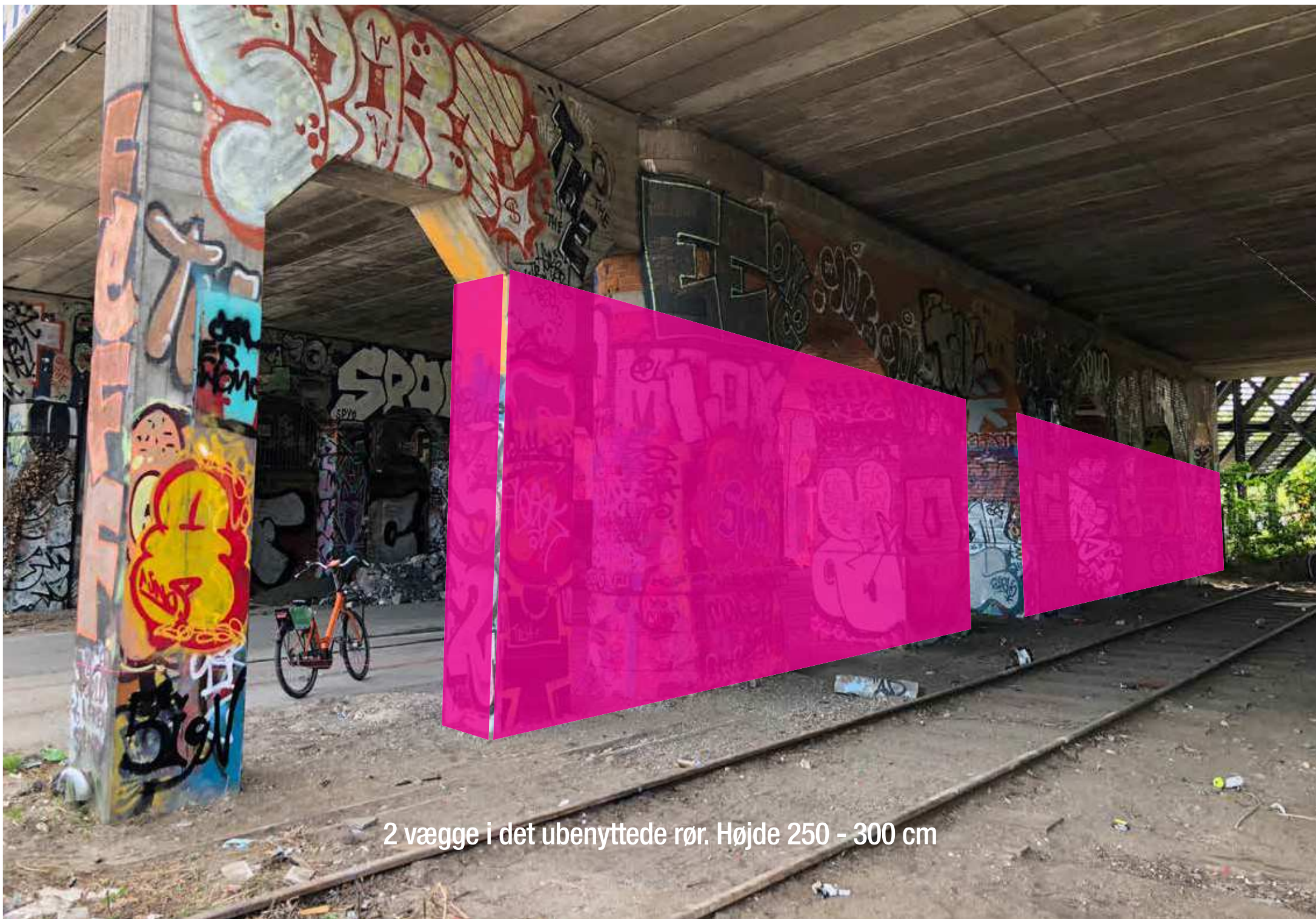
2 vægge i det ubenyttede rør. Højde 250 - 300 cm