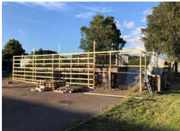
HELSINGBORG - GÅSEBECH GRAFFITIPARK