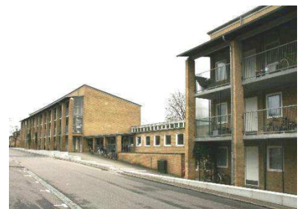
Arkaderne mod øst med en 1-etages institution

Tingbjerg er opført på grundlag af en bebyggelsesplan udarbejdet i 1950 af Arkitekt Steen Eiler Rasmussen i samarbejde med havearkitekt C. Th. Sørensen. I 1956 påbegyndtes byggeriet og størstedelen af bebyggelsen var færdigopført i 1970. I 2018 er der opført et kulturhus tegnet af arkitektfirmaet COBE. Bygården mod Ruten stod i medio 2020 færdigbygget med butikker og private boliger på det førhenværende Lille Torv.