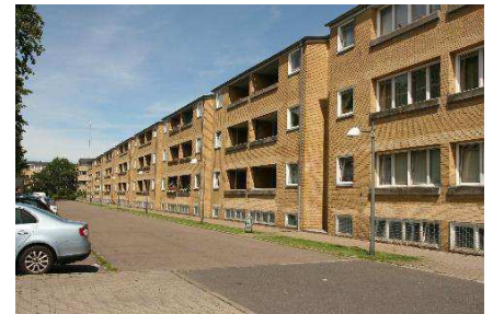
Facader mod gade med opdeling i mindre enheder