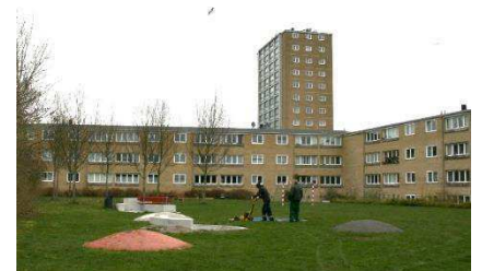
Højhuset set fra sydvest