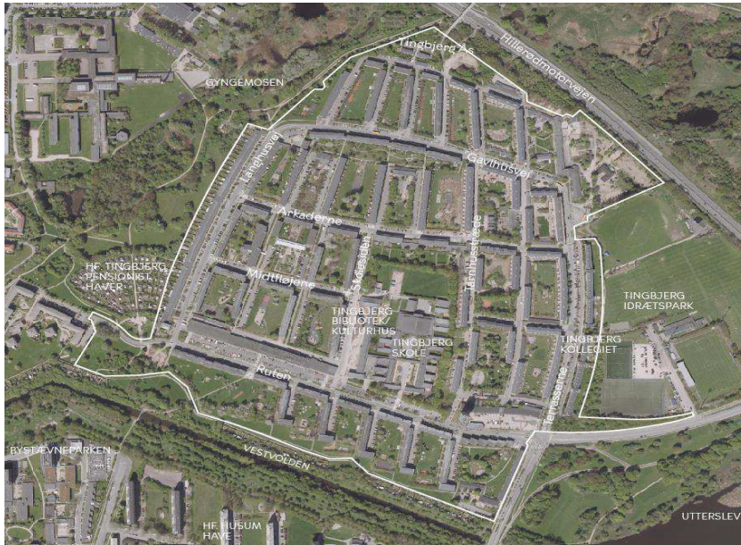
Luftfoto af Tingbjerg med lokalplanafgrænsningen markeret med hvidt.

Vejbetjening sker med et net af veje, der via et ringvejssystem (Ruten-Terrasserne-Gavlhusvej-Langhusvej) er koblet til det overordnede vejnet. For at undgå en monoton bydel har Steen Eiler Rasmussen søgt at gøre vejene så karakterfulde som muligt. Dette er løst ved at differentiere gadenettet, så hver vej og gade er udformet efter sin specielle placering og funktion inden for området, og ved at vejene krummer.