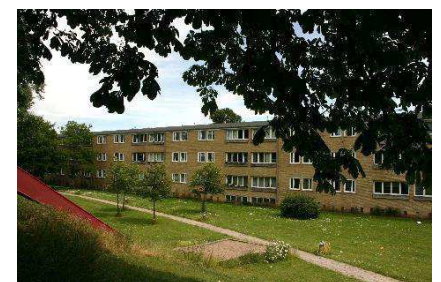
Terrænforskelle i haverum