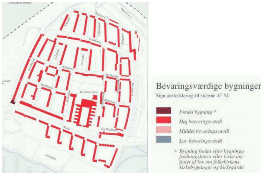
Kort: Bydelsatlas Brønshøj-Husum