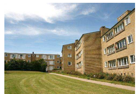
Haverum med facader der fortanner