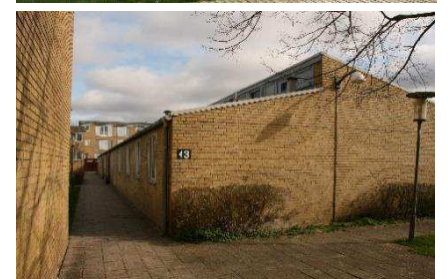
Institutionsbygninger i 1 etage og med forskudte tage