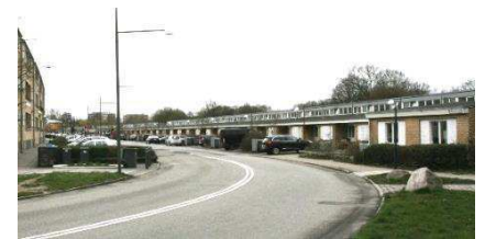
Rækkehuse ved Langhusvej