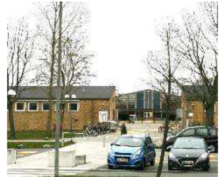
Skolen set fra Ruten

C. Th. Sørensens landskabsplan for Tingbjerg fremhæver bebyggelsesplanens store linjer og træk i Tingbjerg, der i dag også kan genkendes i bebyggelsen. Hovedideen var at skabe de bedste forudsætninger for et socialt liv udenfor både for børn, unge, voksne og ældre med hver deres behov. Det var C. Th. Sørensens idé, at børn og voksne skulle have adgang til de samme landskabstyper, som man kender fra landet: Sandstranden, engen og lunden. Landskabstyperne stiliseres til sandkasser, til græsplæner og til beskyttende og skyggegivende beplantninger. Med randbeplantning, træerækker og plateauer og terrænbearbejdning