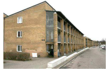
Arkadernes kurvede forløb set mod vest