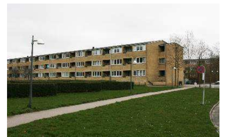
Facade mod have