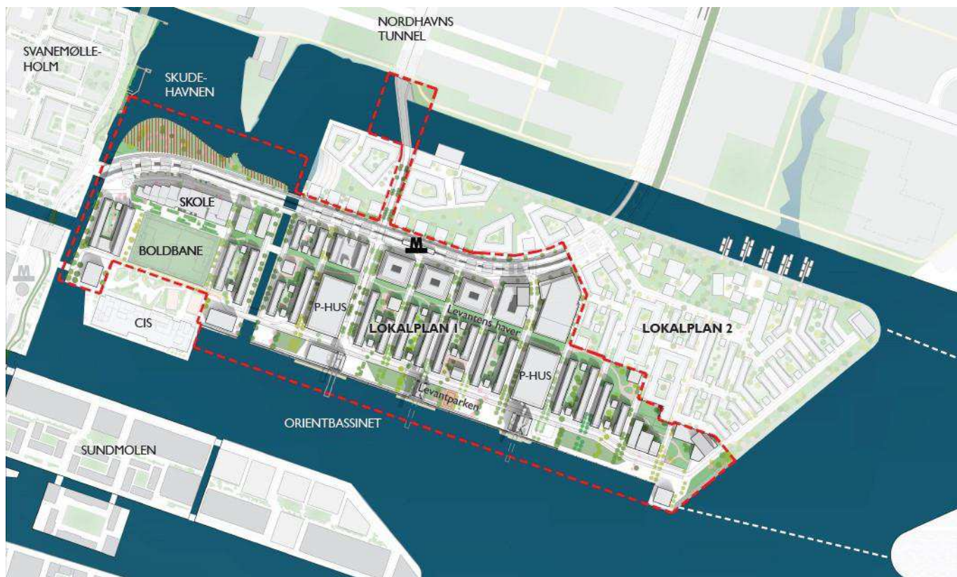
Foreløbig masterplan. Lokalplanafgrensningen for Levantkaj I er vist med rød stiplede linje og lokalplanafgrensningen for Levantkaj. Bebyggelsesplan og infrastruktur bearbejdes i den videre proces. Illustration: Entasis. TMF har på skitsen indtegnet to mulige bud på én mulig forbindelse til Lynetteholm samt bygherres forslag til opfyld i Skudehavnen, som er vist med rød skravering.