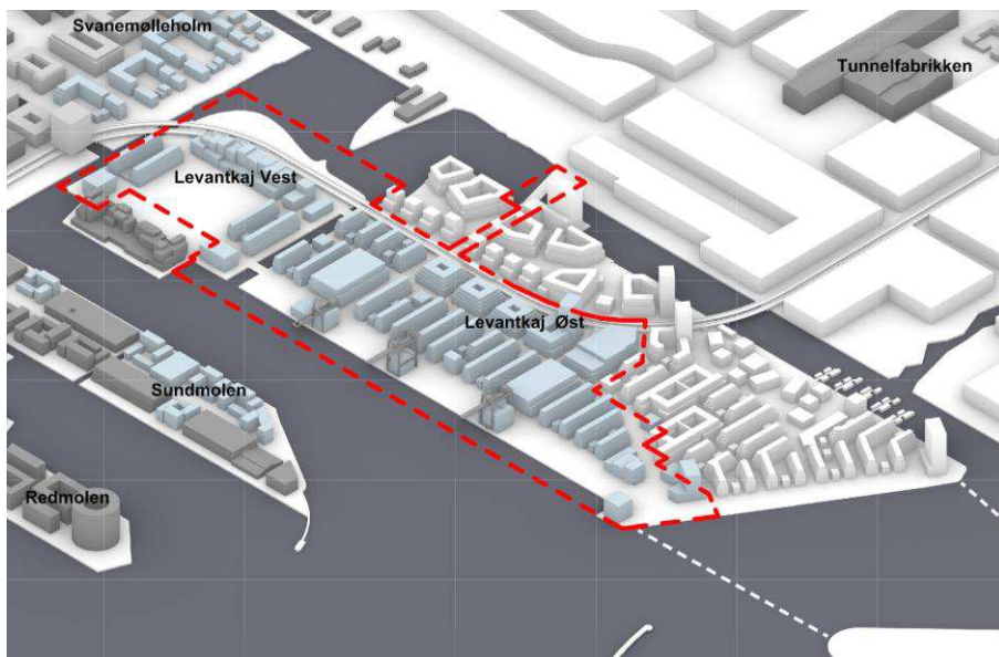
Foreløbig volumenmodel af bygherres forslag til bebyggelsesplan set fra sydøst mod nordvest. De blå bygninger er nye bygninger i det aktuelle lokalplanforslag. De grå bygninger er eksisterende og de hvide er bygherres volumenstudier af de omkringliggende områder. Lokalplanafgrænsningen for Levantkaj er vist med rød stiplede linje. Illustration: Entasis. TMF har på skitsen indtegnet to mulige bud på én mulig forbindelse til Lynetteholm.