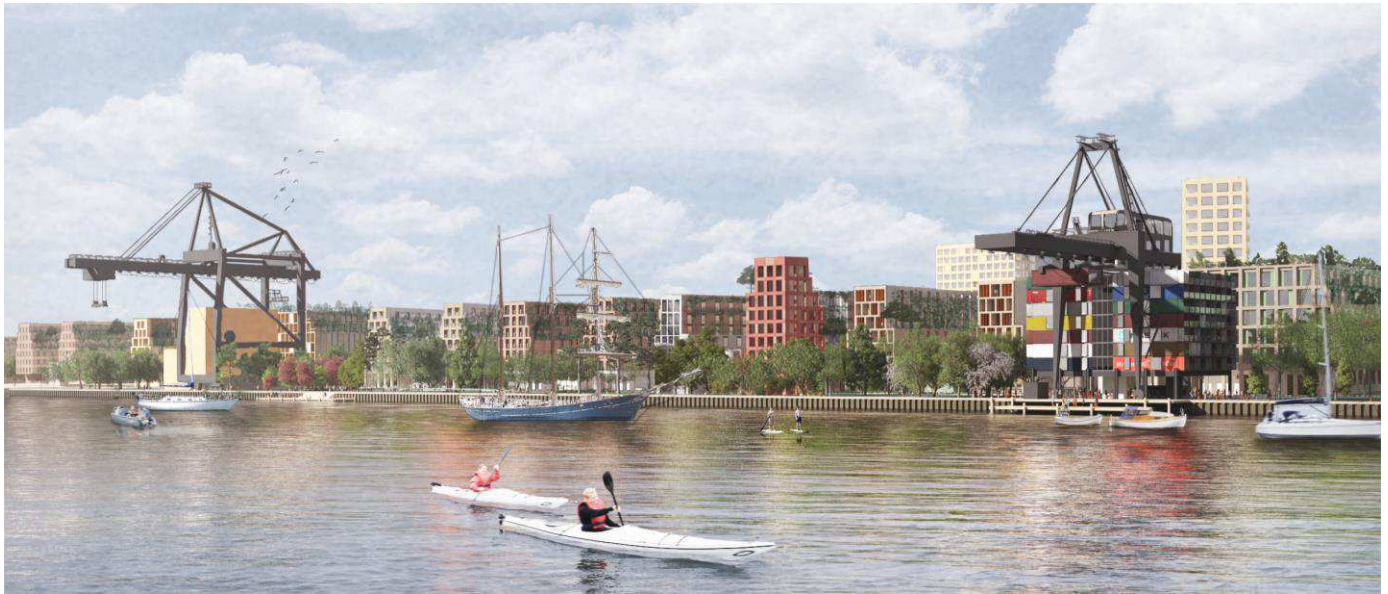
Visualisering, der viser et eksempel på nybyggeri mod Levantparken. Illustration: Entasis.