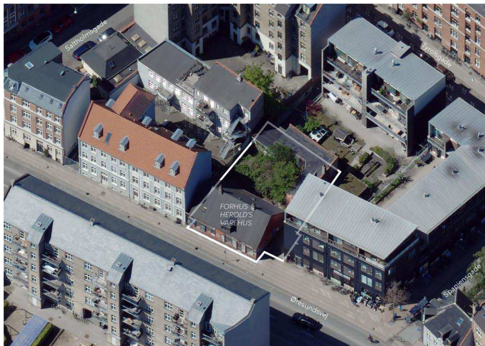
Området set mod vest. Lokalplanområdet er indtegnet med hvid linje, og de vigtigste gader og bygninger er navngivet.

Københavns Kommunes Arkitekturpolitik har bl.a. som mål, at ny arkitektur skal bygge videre på lokal egenart, og at eksisterende kulturværdier i bymiljøer respekteres. Med udgangspunkt i stedets fortælling bevares arkitektonisk og/eller kulturhistorisk væsentlige bygninger. De enkelte byområder suppleres og transformeres, og der tilføjes ny arkitektur, som tolker og fornyer det allerede eksisterende. På den måde styrkes arkitektoniske sammenhænge i forlængelse af områdets egenart og fortælling.