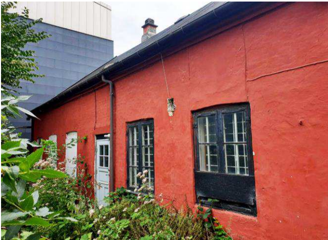
Forhusets bagfacade set fra gårdrummet mellem bygningerne på Øresundsvej 21.