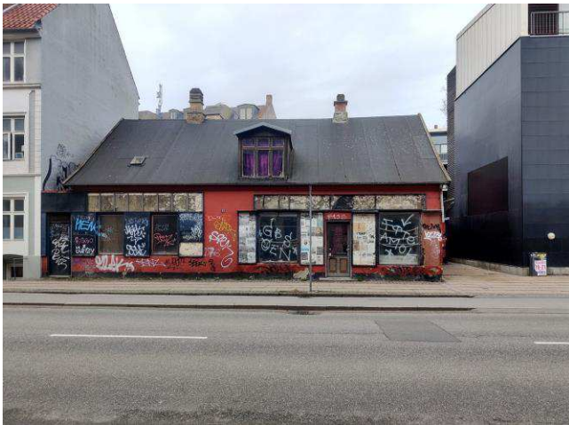
Forhusets facade set fra Øresundsvej.