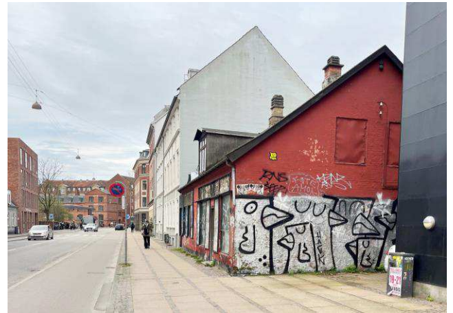
Forhuset set i retning mod Amagerbrogade og i relation til gadens skala.