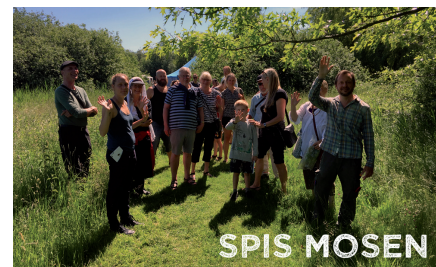
Spis Mosen Sanketure i Utterslev Mose i foråret og efteråret

I gennem et par år har vi haft et aktivitetsprogram for mindre aktiviteter der handler om natur, miljø og udeliv.