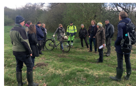
Ekspeditioner til bydelens naturperler Kyndige guider viser bydelens mange naturperler frem. Hvor skal vi hen?