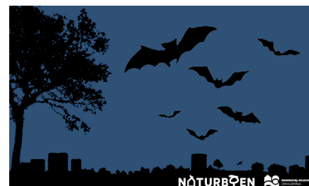
Flagermus ture I Kirkemosen og måske i andre parker i bydelen?