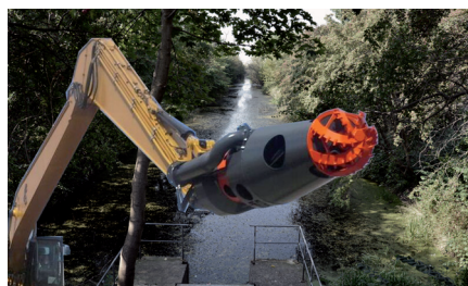
Fæstningskanalen Sandsynligvis fortsætter oprensningen af Fæstningskanalen i vinteren og foråret. Vi tager på tur med projektlederen og ser på teknikken bag oprensningen. Marts - april 2019