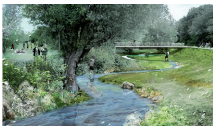
Harrestup Å Åen løber gennem bydelen ved Vestvolden og udveksler vand med Fæstningskanalen. Herefter løber den under Islevhusvej og følger bydelsgræsen langs de matrikler der ligger på den sydlige side af Kildeløbet frem mod Åvendingen. Det store naturgenopretningsprojekt får ikke den store betydning for denne strækning, men ikke desto mindre bør der arrangeres en tur i området til en fortælling og åens historie, miljøproblemerne og de kommende indsatser.