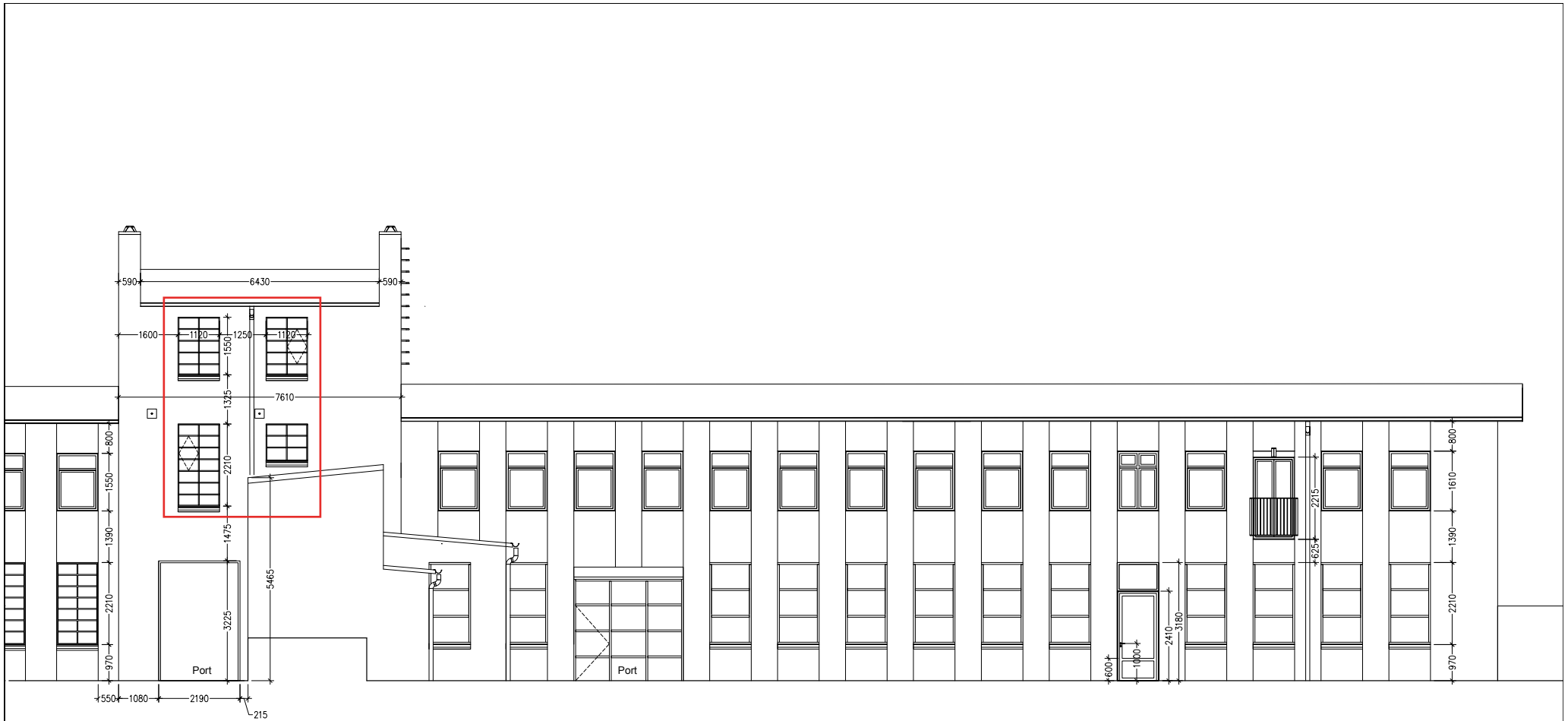
Facadeudsnit 1:100 - Østfacade mod gård