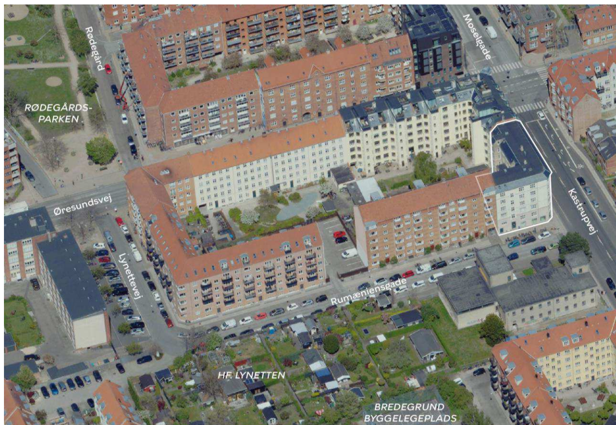
Området set mod nord. Lokalplanområdet er indtegnet med hvid linje, og de vigtigste gader, parker og bygninger er navngivet.

Andelsforeningen Udsigten ønsker et tillæg til den eksisterende lokalplan 300 Kirkegårdsvej, så lokalerne i stueetagen kan anvendes til marskandiserbutik og café. For nuværende huser stueetagen Perlemors Kaffebær, der er en lille butik, der sælger lamper, porcelænsfigurer, kaffe og bagværk. Der er den 1. juli 2024 givet en treårig tidsbegrænset dispensation til at drive café på adressen.