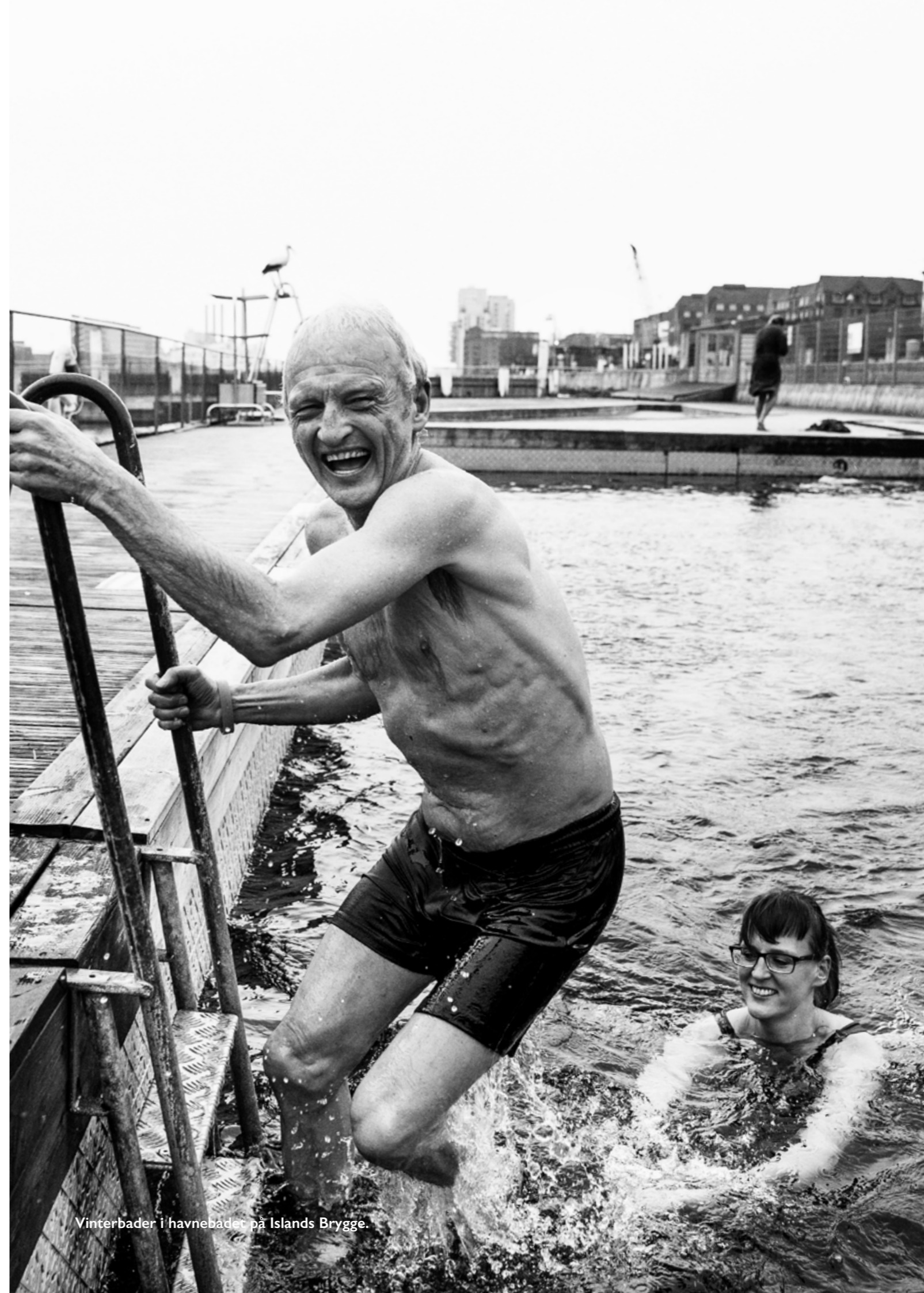
Vinterbader i havnebædet på Islands Brygge.