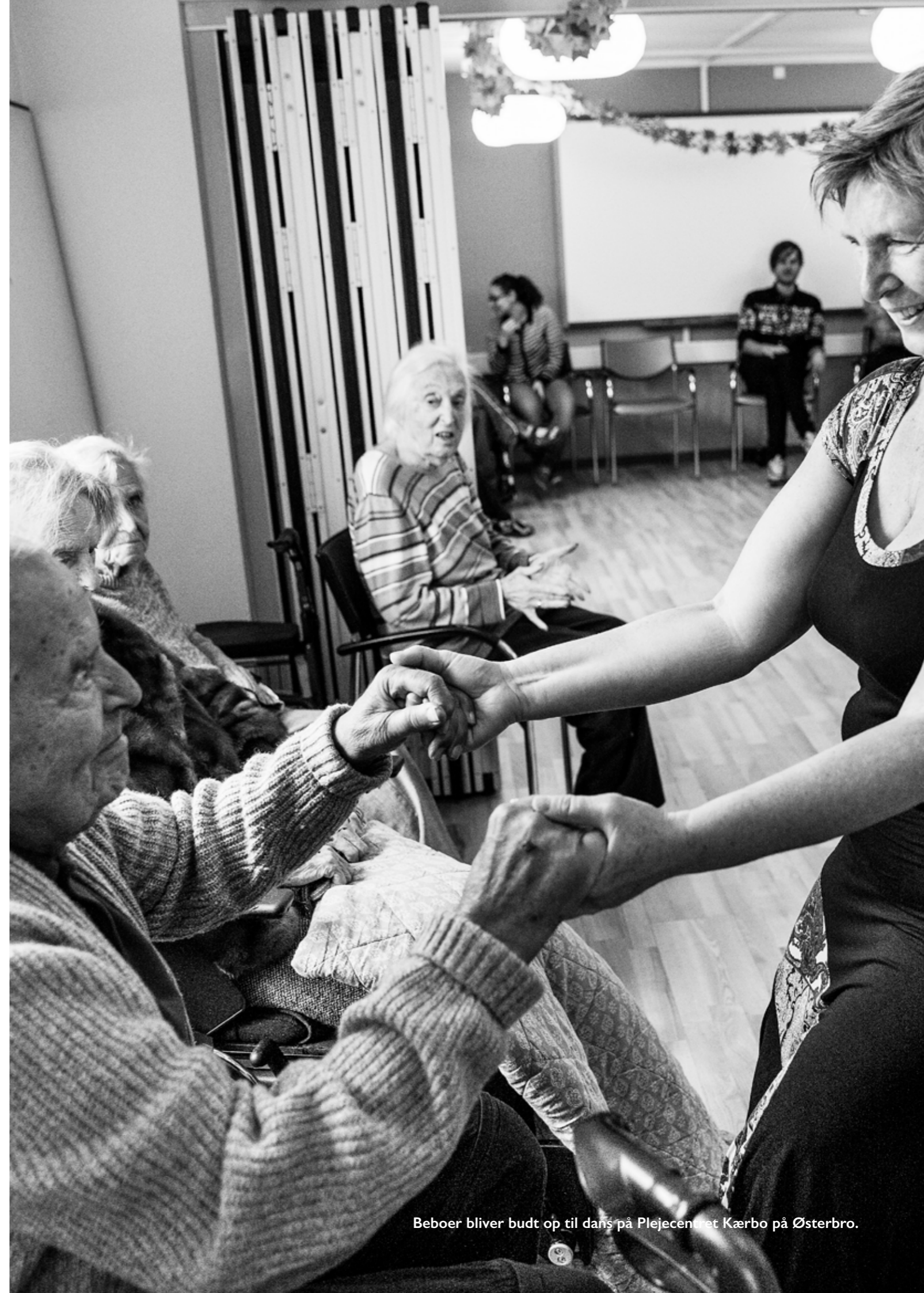
Beboer bliver budt op til dans på Plejecentret Kærbo på Østerbro.